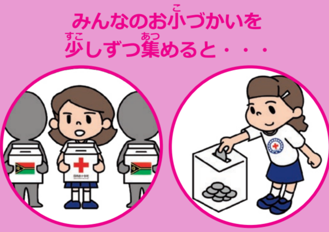
みんなのおこづかいを すこ 少ずつ集めると…