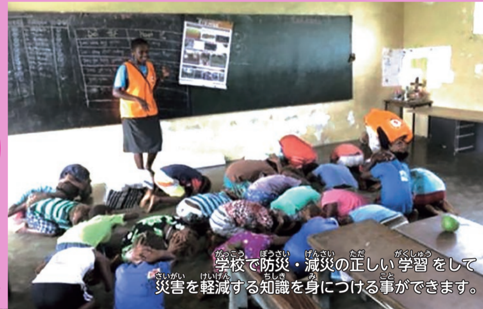
がっこう ぼうさい げんさい なた かくしゆつ 学校で防災・減災の正しい学習をして さいがい けいげん ちんさい こと 災害を軽減する知識を身につける事ができます。