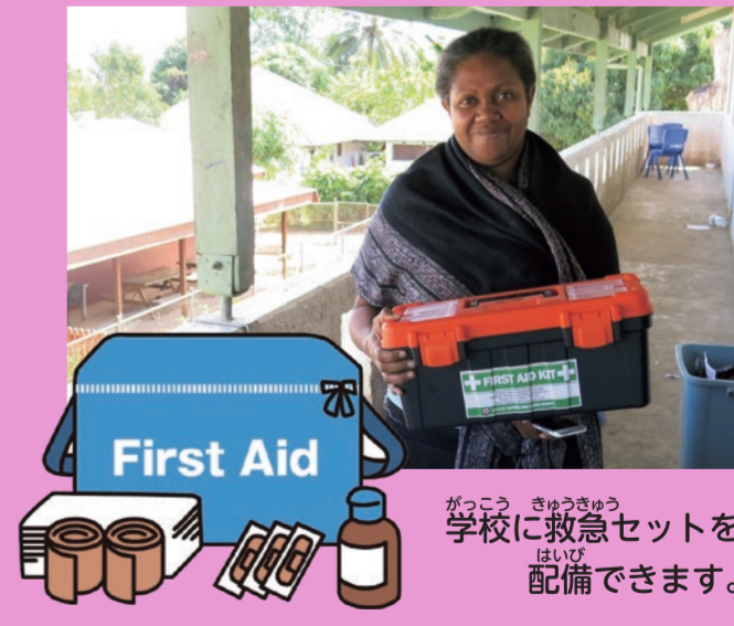
がっこう きゅうきゅうせつ 学校に救急セットを はいつけ 配備できます。