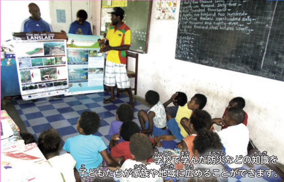
がっこう ぼうさい ちんさい こと 学校で学んだ防災などの知識を 子どもたちが家族や地域に広めることができます。