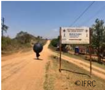
シレシ診療所前の道路と案内標識

読者の皆さんは、エスワティニにある赤十字社の正式名称をご存知でしょうか。答えは、バファラリ・エスワティニ赤十字社 (Baphalali Eswatini Red Cross Society)。バファラリとは現地語でファーストレスポンスを意味しています。かつてハリケーンが国を襲いどこからも必要な支援が得られなかった時、唯一行動を起こしたのは当時のスワジランド(旧国名)赤十字社のボランティアたちでした。テントを張って支援をしている彼らの姿に感銘を受けた当時の国王が、その貢献を称してバファラリと命名したのです。