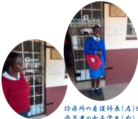
診療所の看護師長(左)と受益者の女子学生(右)

現在シレレ診療所が抱えている問題は、救急車が使用できないことです。2019年に診療所が保有していた救急車が故障してしまったため、大きな病院に重症患者を搬送することができずにいます。