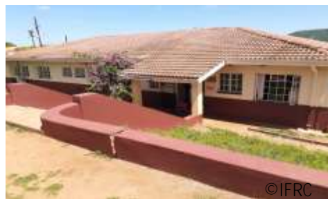
シレレ診療所の外観。小さな診療所は多くの診療サービスを提供している。

エスワティニ南部にあるシレレ(Silele)診療所は、バファラリ・エスワティニ赤十字社(以下、エスワティニ赤)が全国で運営する3つの診療所のうちのひとつで、日本赤十字社(以下、日赤)は2010年以来国際赤十字・赤新月社連盟(以下、連盟)を通じて支援を行っています。この診療所は、今からちょうど30年前の1990年、まさに日赤の支援によって設立されました。現在では当時のことを知る職員も、資料も残されていない一方で、シレレ診療所の入り口に掲げられた金のプレートには、しっかりとその事実が刻まれ、今日においても村人に伝えています。