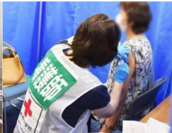
ワクチン接種の様子