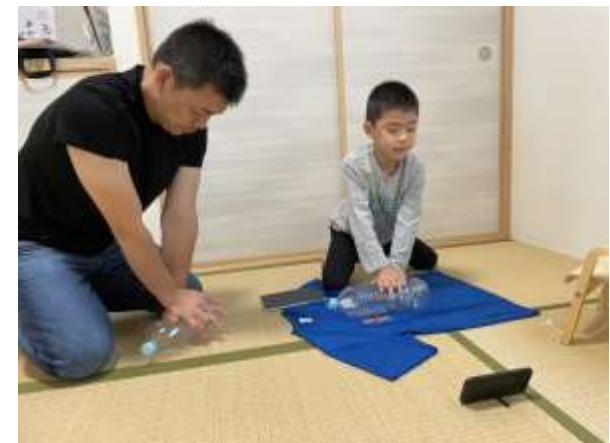
救急法オンライン講習に 参加する親子