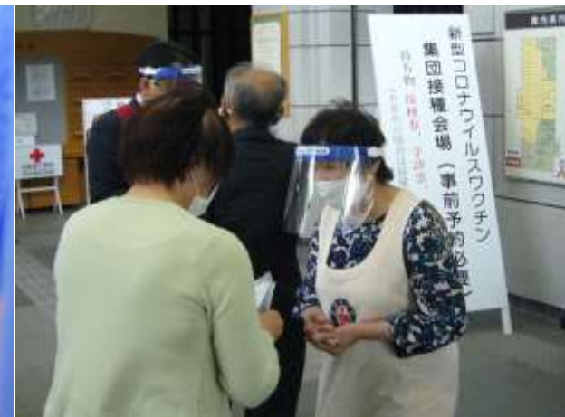
ワクチン接種受付前に 書類確認する奉仕団員