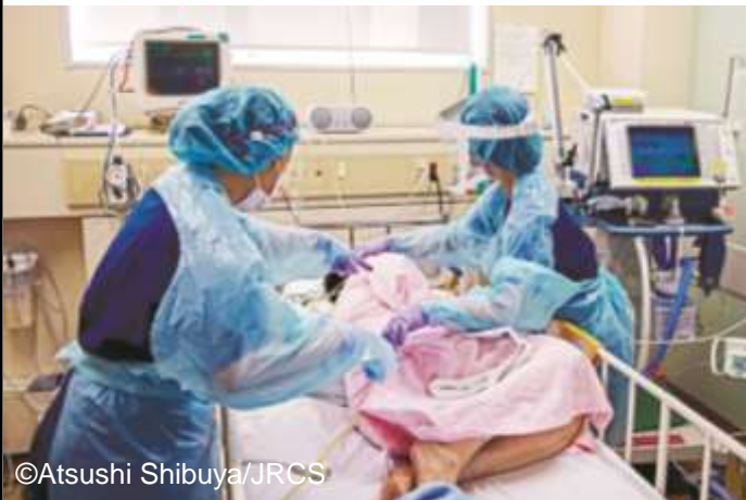
救命救急センターの病室内