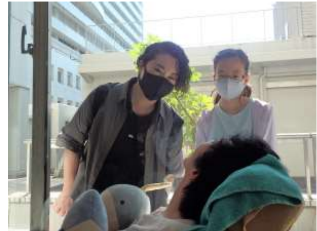
社会福祉施設における 窓越し面会の様子