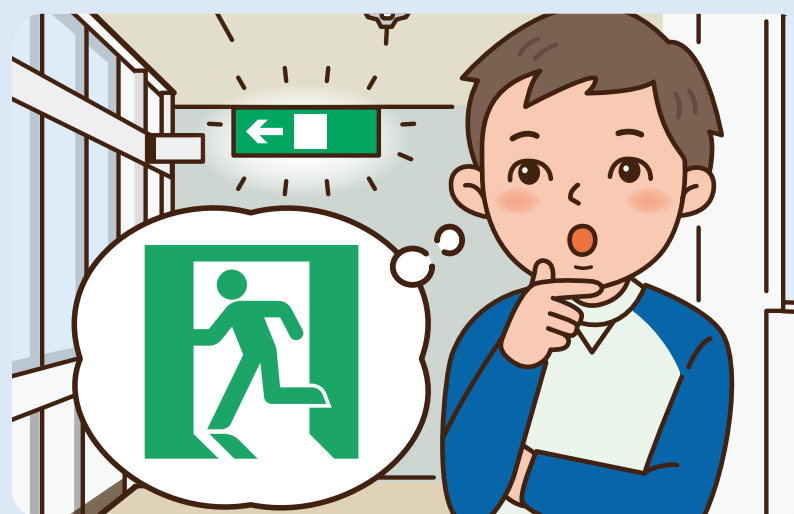
ひじょうぐち 非常口