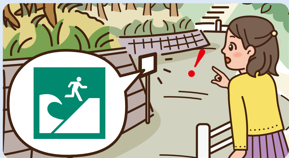
つなみひなんばしょ 津波避難場所

マークには、その場所が災害時に危なくなることや、どこへ逃げればいいのかを伝えているものがあります。また、どこから逃げるのかを伝えるものもあります。