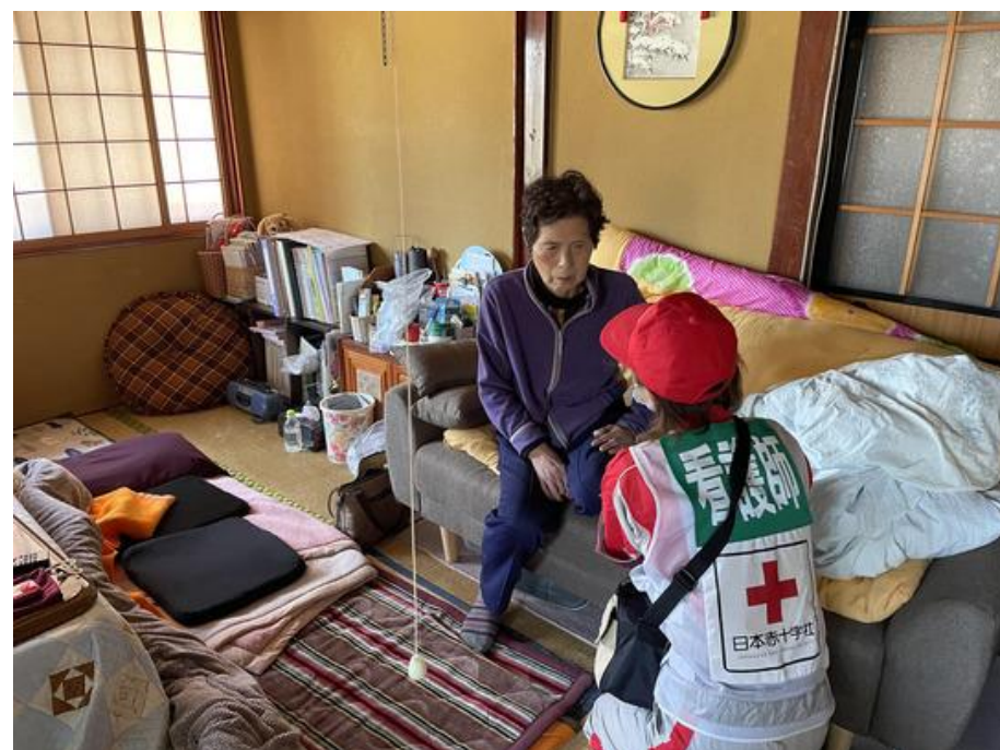
「被災地域を戸別訪問して活動する 日赤こころのケア班(石川県珠洲市)」