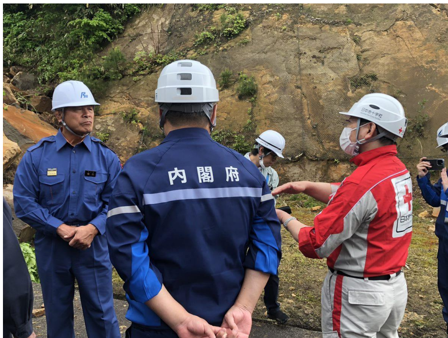
「知事の被災地視察に同行する 日本赤十字社職員(石川県珠洲市)」