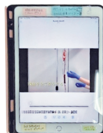
(図2) インシデントが多いカリウム吸着フィルター使用方法の動画作成(ベッドサイドで視聴できるよう、タブレットに配信)