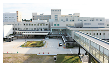
(図1) 富山大学附属病院の概要

輸血看護師の業務は「安全管理」「リスク予測」「副反応の早期発見と対応」「患者の不安軽減」など多岐に渡り、現場の看護師に寄り添い頼れる存在になることが臨床輸血看護師としての責務です。各看護師が自信を持って安全に業務を遂行できるよう、一般的な知識に加えて輸血に関わる日々の業務から問題点を見出し、継続的に現場にフィードバックすることも大切な輸血看護教育になると実感しています。