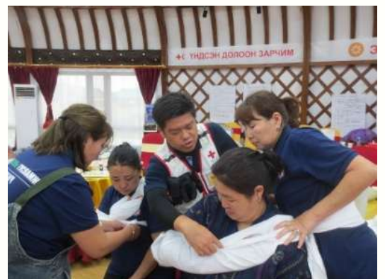
救急法の指導をする日赤職員

救急法の指導者育成を担う日赤職員が2024年度から延べ4名、モンゴルに赴き、モンゴル赤十字社の支部職員に向けた救急法の講習を実施しました。モンゴル国内に救急法を根付かせ、資器材を整備し、救急法に対する人びとの意識や技術力を高めていきます。