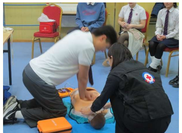
救急法講習を受ける高校生

2026年度は、5支部に救急法研修の資器材を整備するとともに、救急法担当職員を対象とした指導スキル強化のための研修を日本赤十字社支援のもと行い、現場対応力の向上を目指します。