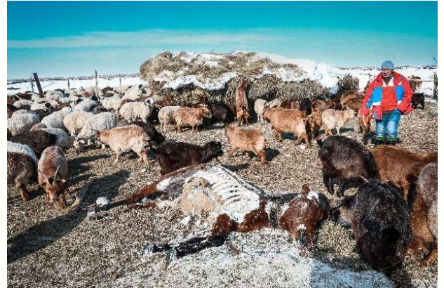
「ゾド」と呼ばれる冷害の影響により家畜被害を受けるモンゴル遊牧民

令和8年度には新たに3支部(全33支部)に相談室を設置し、各支部のこころのケア担当者の育成にも継続して取り組んでいきます。