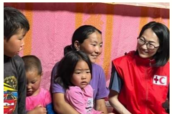
ゲルの中で遊牧民家族に話を聞く日赤職員

日赤は、緊急時のこころのケア専門家を定期的に派遣し、ガイドライン策定への助言や研修への協力等を通じてこの取り組みを支援しています。