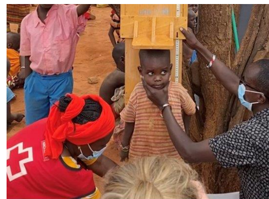
ケニア赤十字社は食料配布のほか、栄養失調の子どもたちに補助食品を提供するプログラムも実施しています

こうした緊急支援は、命をつなぐためになくてはならないものですが、他方で限界もあります。それは、食料配付は永遠に続けることができないこと、食料危機のような人道危機は将来も繰り返し起こりうること、限られた資源では多くの人々を助けることができないこと、さらには、アフリカに内在する慢性的な貧困、安全な飲料水の不足、栄養不良、劣悪な衛生環境が内在する現実があるためです。