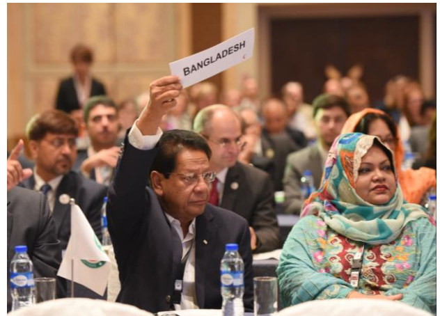
活発な議論の場となる地域会議

中東地域を含むアジア・大洋州地域の赤十字・赤新月社は4年に1度一堂に会し、各国の抱える問題や課題について話し合い、連携を深めるために、地域会議を実施しています。2018年11月、フィリピンに51の国と地域の赤十字・赤新月社の代表が集まり10回目の地域会議を開催しました。