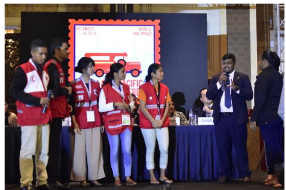
ユースボランティアが率先して意見を発表（左から3番目が日本赤十字社のユースボランティア

各地域からはユースボランティアも多数参加。ユースボランティアが率先して活動することで、各国の赤十字・赤新月社がより強固になり、結果的により災害などに強いコミュニティが形成されます。彼らは、「#YouthAtTheCentre（ユースを中心に!）」と銘打ち、ユースの意思決定への参加や最新の技術を活用した革新的な活動の実施などを訴えました。