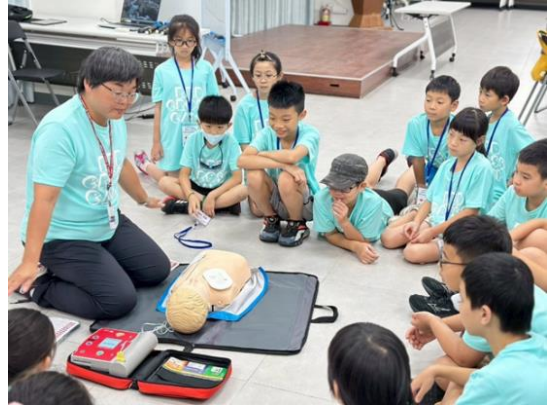
防災キャンプに参加した子どもたちは、家に帰って学んだことを家族に伝えると語りました

台湾赤十字組織は、災害対応力の向上を目的に赤十字ボランティアを対象とした救助訓練も強化しています。救助訓練やドローン操作などの研修を実施し、倒壊建物での救助活動や情報収集など、現場で求められる技能の習得を進めています。こうした取り組みは、被災地の花蓮県がより安全で強じんな社会へと前進し、地域全体の災害対応力が高まることを目指しています。