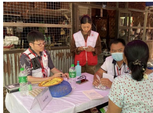
(左) ミャンマー赤十字社が展開する巡回診療に同行する日赤看護師 (写真中央左) (右) 巡回診療に同行し、よりよい医療サービスを提供できるよう現地の医師への助言やフィードバックなどを行う日赤医師 (写真一番左)