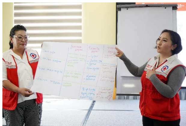
写真：2022 年同基金配分先のひとつ、モンゴル赤十字社より

デジタルコミュニケーションツールを取り入れることにより広報活動を改善し、地域社会に対する説明責任と透明性の強化に取り組んでいる様子。