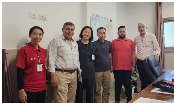
10月7日以前の事業のチームの集合写真