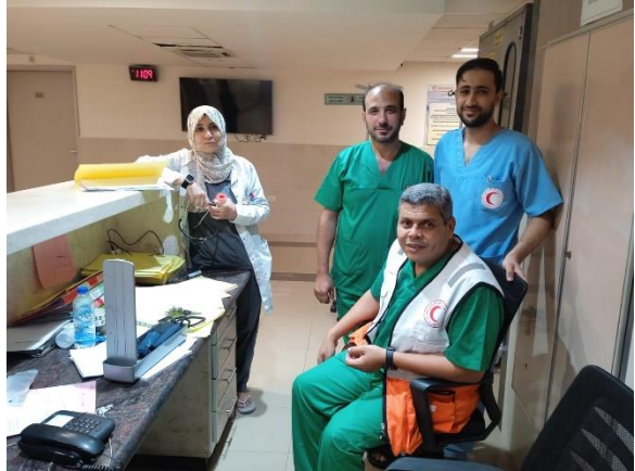
看護部長（1番手前）から送られてきた写真

それまでも事前に告知されるような形で小規模なデモや衝突はありましたが、今回については現地スタッフも不意打ちの様子でした。爆撃音がどんどん激しくなり、すぐ近くに攻撃を受けたかと思いました。もともと有事の際に備えて事前に荷物をまとめており、まずは当日中にICRCの別の宿舎（シェルター）に移動しました。移動途中に避難経路にあった建物が激しい攻撃を受け、その破片が散乱していたため、進路を変更するなど、かなり緊迫した状況でした。アルクッツ病院の看護部長に連絡を取り、1シフト24時間の緊急態勢が敷かれ、病院が手配した車両で医療スタッフ送迎をしていることを把握しました。看護部長からは「危険なので病院には来ない方がいい。自分たちはこんな状況に慣れているから大丈夫」と言われました。その後も負傷者が絶え間なく運ばれてきて、看護部長自身は10日以上滞在し、家族とは電話で安否を確認していました。