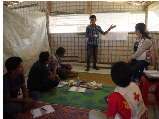
避難民同士で学んだことを伝え合う

言語や文化も異なる避難民のことを一番よく知っているのは避難民ボランティアです。だからこそ、赤十字の支援活動の担い手となるのは彼ら自身なのです。真っ先に脆弱な立場に追い込まれる人々が、迫りくる危機に対応できる力を彼ら自身の手で身に着けていくことを日赤はこれからも支援し続けます。