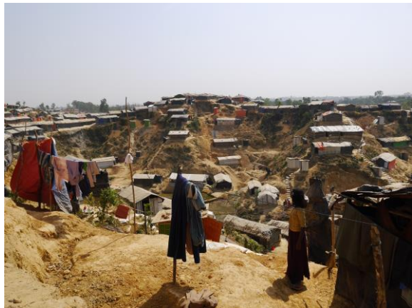
広大なキャンプには約68万人が住んでいる

現地では、蒸し暑い日が続いています。ビニールテントで暮らす避難民の家の中はきっと蒸し風呂のような暑さなのだと思います。避難民キャンプでは、雨季を前に、より一層活発に活動している日赤要員と活動を支える避難民ボランティア、他国赤十字社関係者の汗と熱気が入り混じっています。衛生環境の悪化や地滑りのリスク、洪水など、さまざまな危険の引き金となる雨季はもう目の前に迫っています。