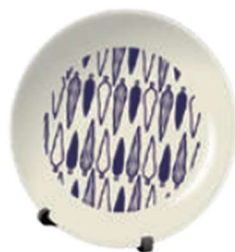
有田焼小皿(スタンド付)