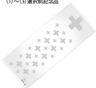
今治産無撚糸フェイスタオル