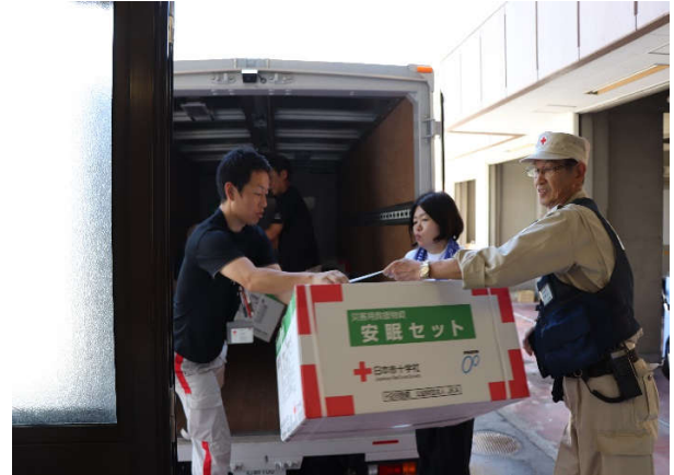
広島県支部より避難所へ救援物資を搬送