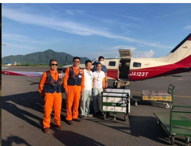
水やバナナを運ぶ赤十字飛行隊熊本支隊