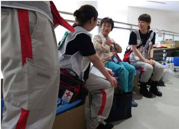
広島県の天応まちづくりセンターで活動する 広島県支部こころのケア班