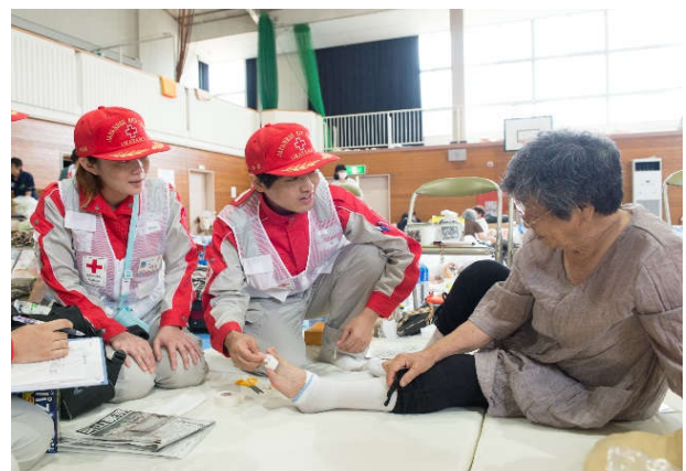
岡山県岡田小学校の避難所で活動している 岡山赤十字病院救護班