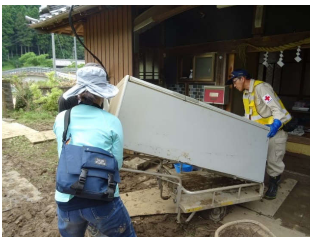
家財道具を運び出す三重県の赤十字奉仕団

現在は、赤十字奉仕団による、安全・衛生管理の注意喚起、炊き出し、ボランティアセンターでの業務支援活動等を行っております。