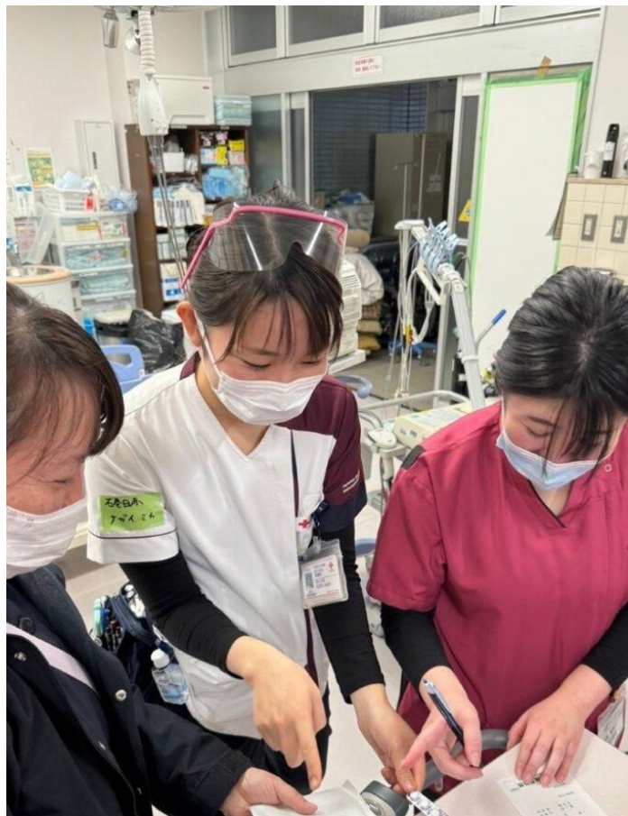
「被災地医療機関支援で現地で活動する 赤十字看護師」(石川県輪島市)