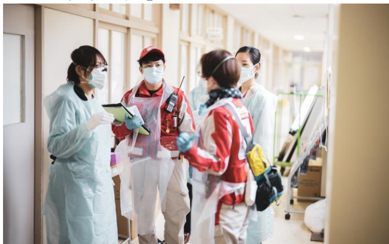
「感染対策をしながら避難所で巡回診療を行う 救護班(石川県輪島市)」