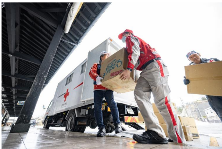
「物資を運搬する赤十字ボランティアと救護班(石川県輪島市)」