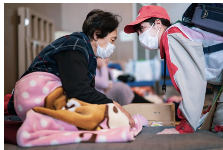
「避難所で巡回診療を行う救護班 (石川県七尾市)」