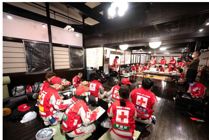
「活動方針についてミーティングをする救護班 (石川県輪島市)」