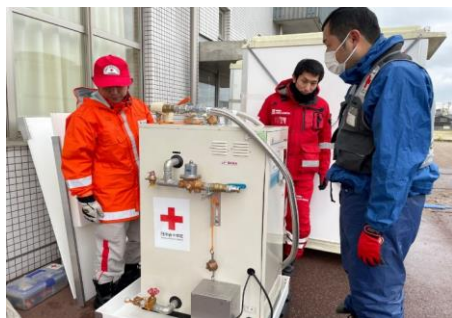
「給水支援の資機材を設置する日赤職員（石川県七尾市）」