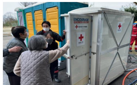
「設備の使用方法を説明する日赤職員（石川県七尾市）」