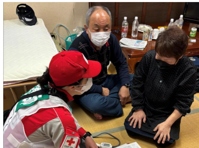
「被災者の声に耳を傾けるところのケア班 (石川県志賀町)」