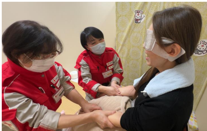
「行政職員に対してケアを行うところのケア班(石川県七尾市)」