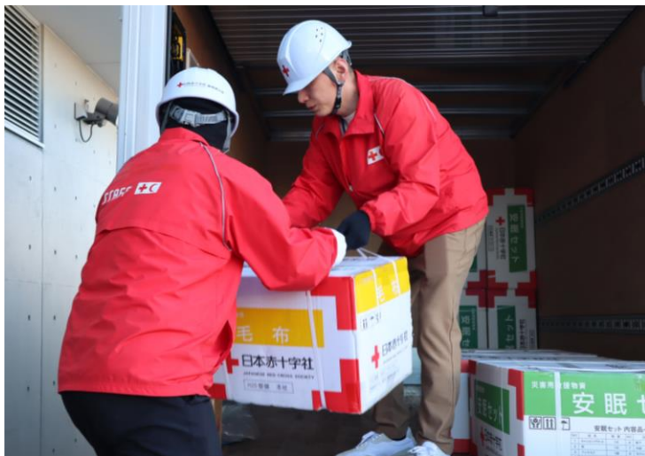
「被災地に届ける救援物資を搬送する 日赤職員(岐阜県)」