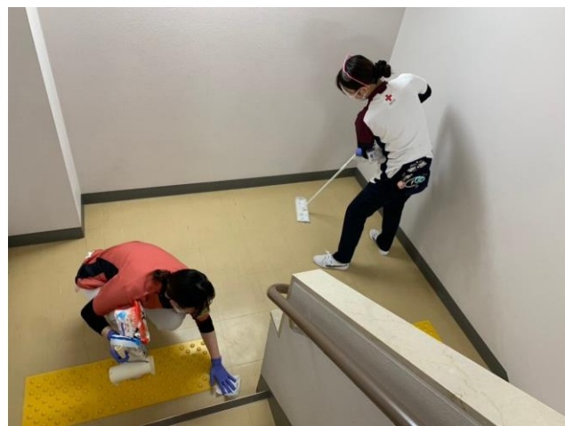
「支援先医療機関で様々な業務を行う赤十字看護師(石川県穴水町)」