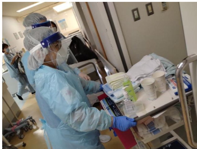
「現地の看護師と協働して活動する赤十字看護師(石川県輪島市)」