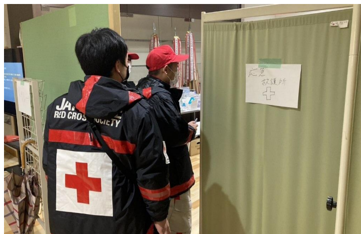
「避難所のアセスメントを行う救護班 (石川県輪島市)」