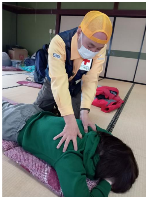
「救護班に帯同し被災者支援活動を行う群馬県接骨師赤十字奉仕団(石川県珠洲市)」