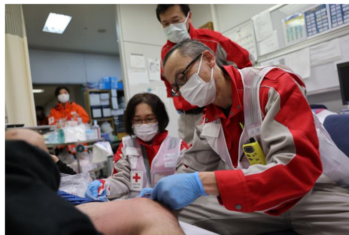
「救護所で被災者の手当を行う救護班 (石川県珠洲市)」