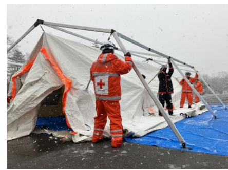
「救護員宿泊用のテントを設営する日赤職員(石川県珠洲市)」