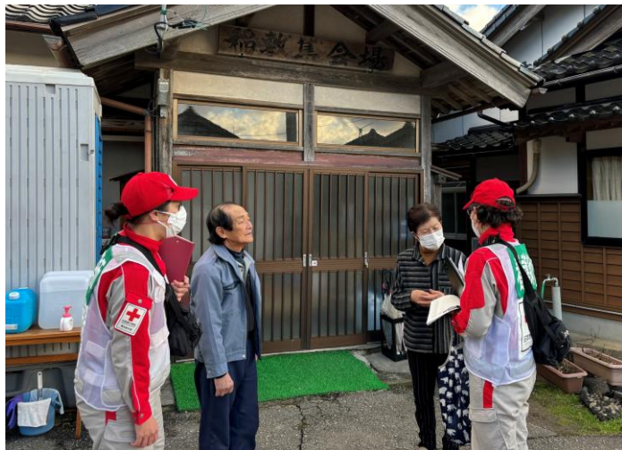
「避難所を巡回するところのケア班 (石川県志賀町)」