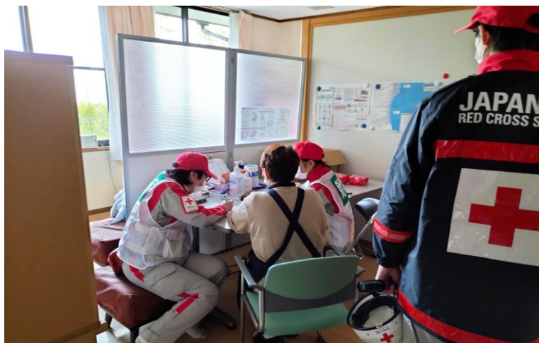
「孤立施設で巡回診療を行う救護班 (石川県珠洲市)」