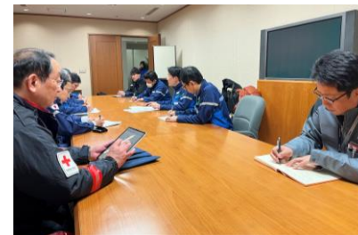
「石川県庁での打合せに 参加する日赤医師(石川県金沢市)」