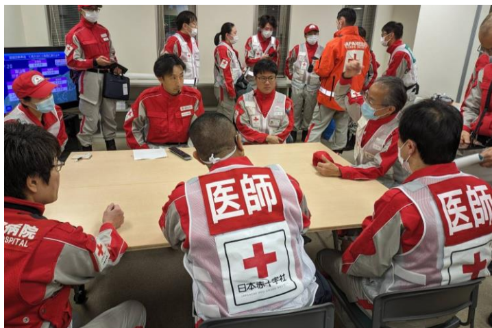
「石川県支部でブリーフィングを受ける救護班 (石川県金沢市)」