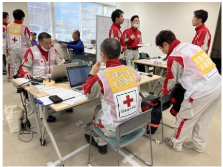
「石川県支部災対本部で業務を行う日赤職員(石川県金沢市)」