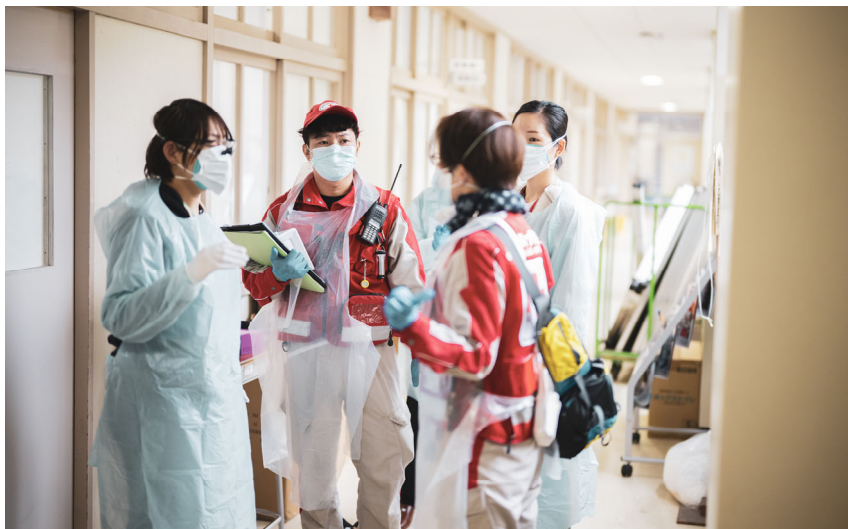
「感染対策をしながら避難所で巡回診療を行う救護班(石川県輪島市)」