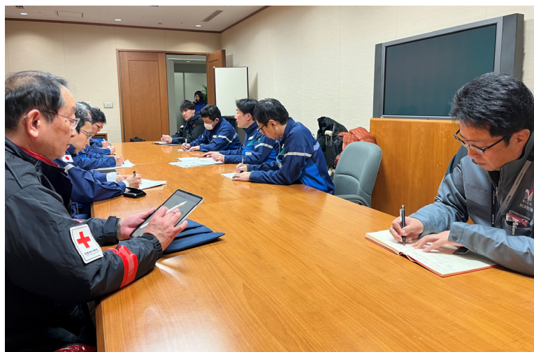
「石川県庁で内閣府調査チームの打合せに参加する日赤医師(石川県金沢市)」