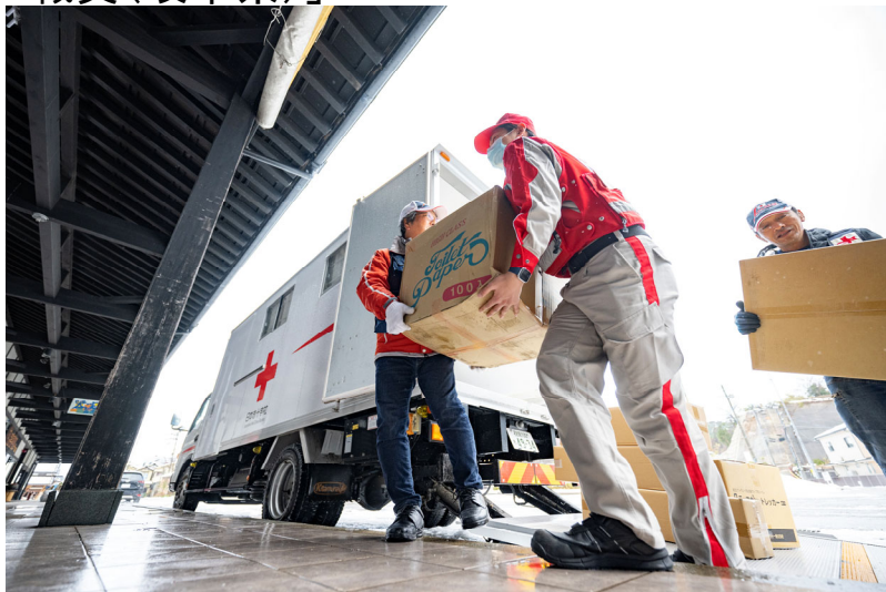
「物資を運搬する赤十字ボランティアと救護班(石川県輪島市)」