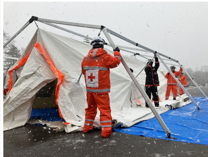
「救護員宿泊用のテントを設営する日赤職員(石川県珠洲市)」