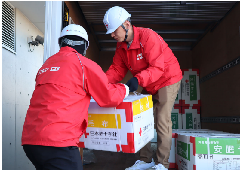
「被災地に届ける救援物資を搬送する日赤職員(岐阜県)」