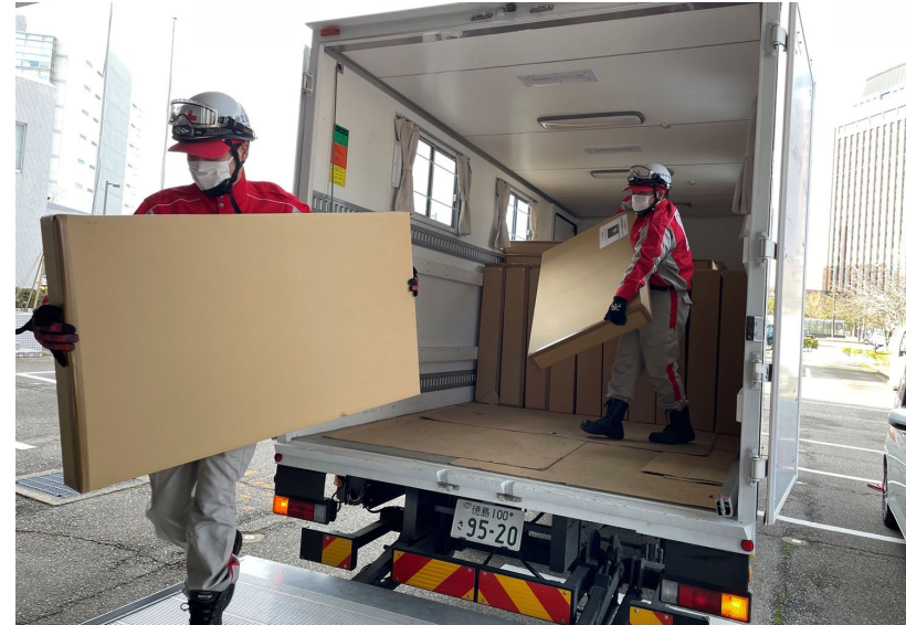
「段ボールベッドを搬入する日赤職員(石川県金沢市)」