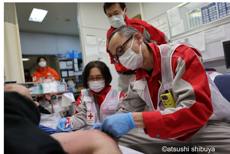
「救護所で被災者の手当を行う救護班 (石川県珠洲市)」