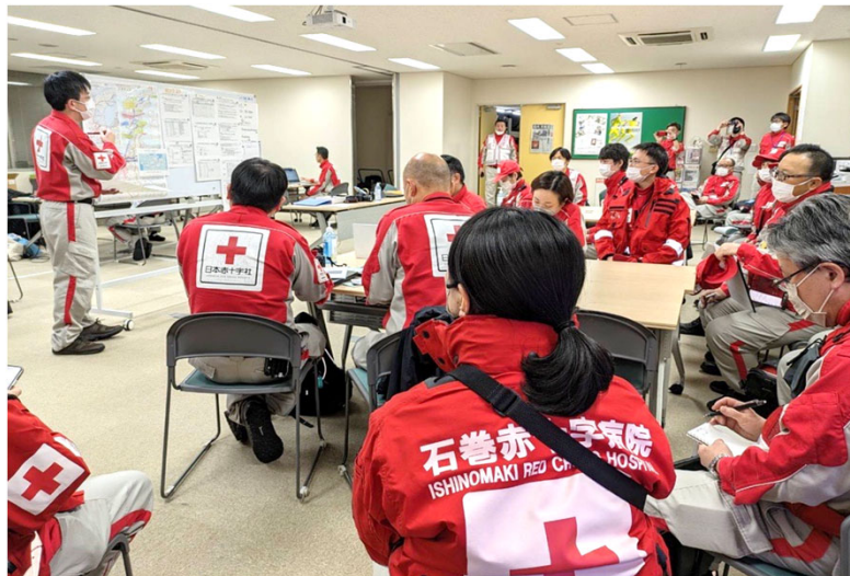
「日赤災害医療コーディネーターから 活動指示を受ける救護班(石川県金沢市)」