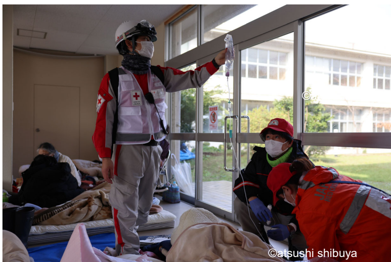
「被災者の救護活動を行う救護班 (石川県珠洲市)」