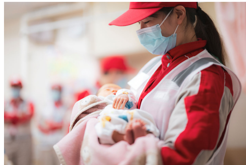
「避難所で赤ちゃんを抱っこする救護班(石川県輪島市)」