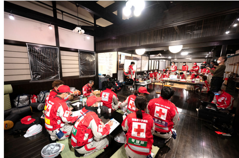
「活動方針についてミーティングをする救護班 (石川県輪島市)」