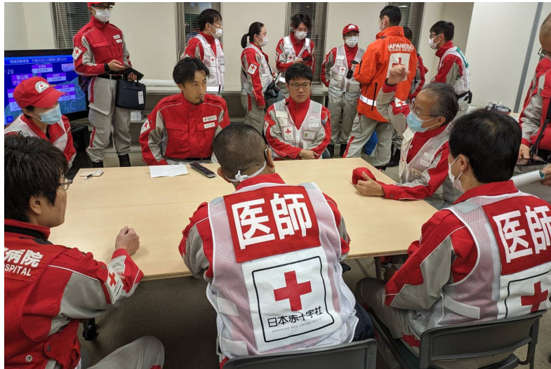
「石川県支部でブリーフィングを受ける救護班 (石川県金沢市)」