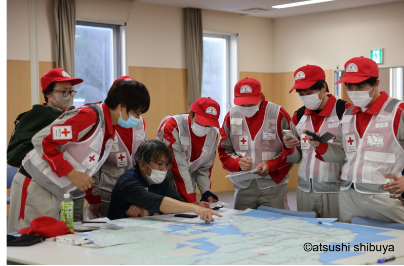
「活動拠点である病院で情報収集を行う救護班 (石川県七尾市)」