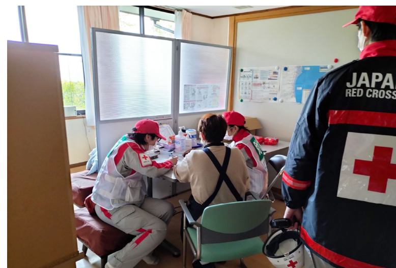
「孤立施設で巡回診療を行う救護班 (石川県珠洲市)」