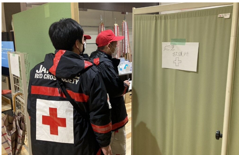
「避難所のアセスメントを行う救護班 (石川県輪島市)」