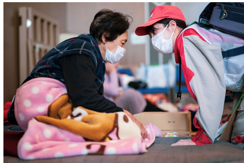
「避難所で巡回診療を行う救護班(石川県七尾市)」