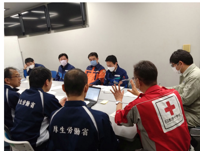
「関係省庁と打合せをする日赤医師(石川県金沢市)」