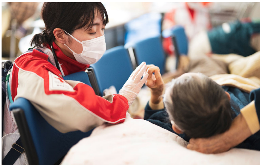
「避難所で巡回診療を行う救護班(石川県七尾市)」