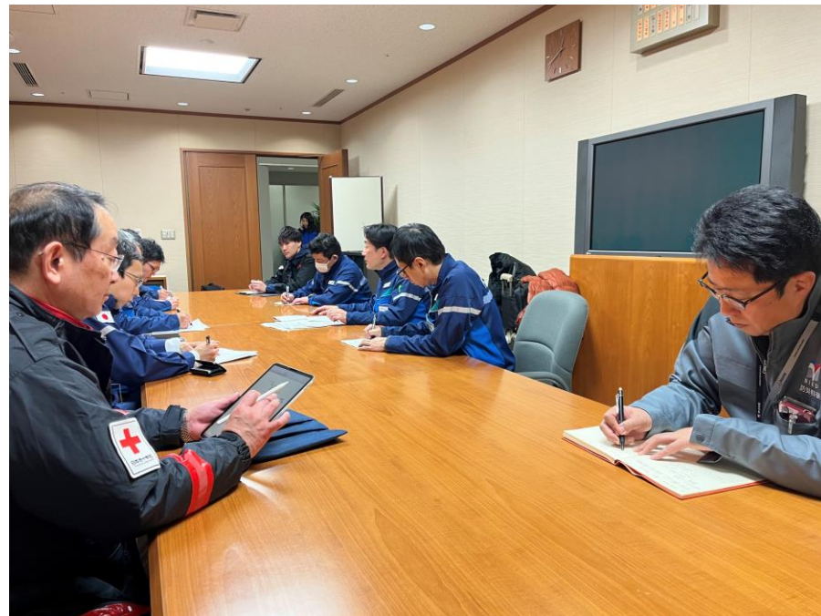
「石川県庁で内閣府調査チームの打合せに参加する日赤医師」