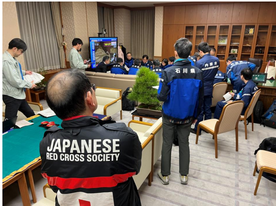
「石川県庁で災害対策本部会議の打合せに参加する日赤医師」