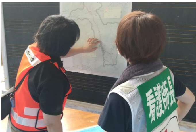
「ボランティアセンターで関係機関と 打合せする日赤職員(福岡県東峰村)」