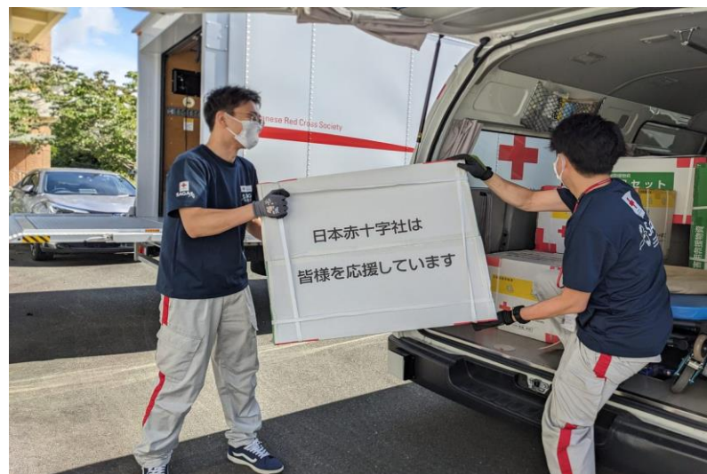
「救援物資搬送の準備をする日赤職員（佐賀県佐賀市）」