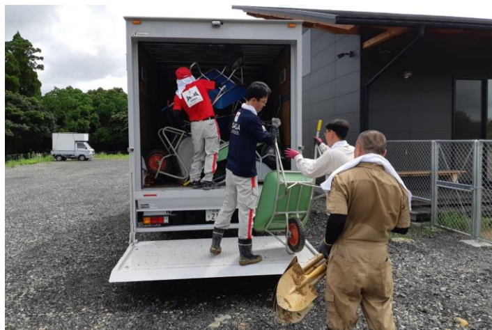
「ボランティアセンターで使用する資機材を 搬送する赤十字ボランティア(佐賀県唐津市)」