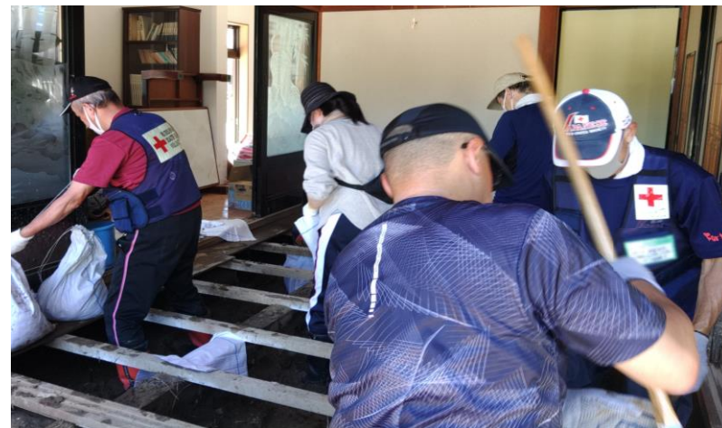
「被災住宅の泥かきを行う赤十字 ボランティア(石川県津幡町)」