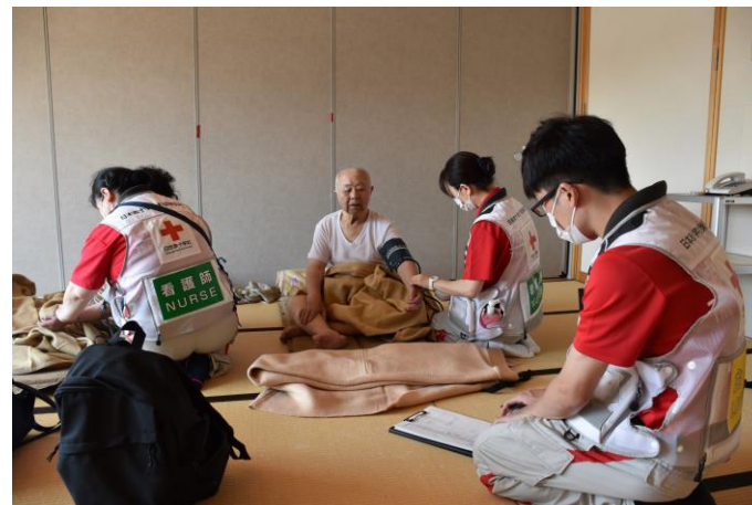
「避難所でこころのケアにあたる こころのケア班(秋田県秋田市)」