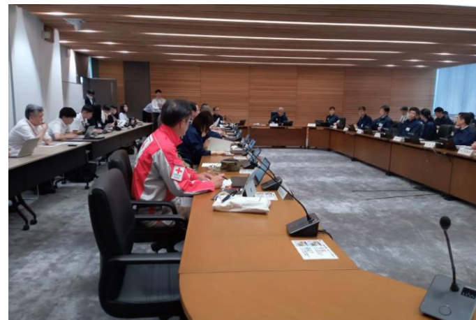
「県災害対策本部会議に参加する 日赤職員(富山県富山市)」