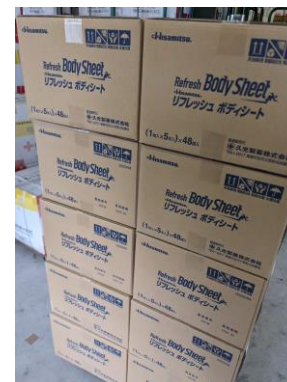
「支援物資リフレッシュボディシート」