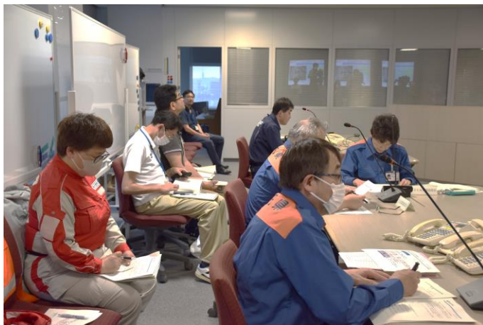
「県災害対策本部会議に参加する 日赤職員(秋田県秋田市)」