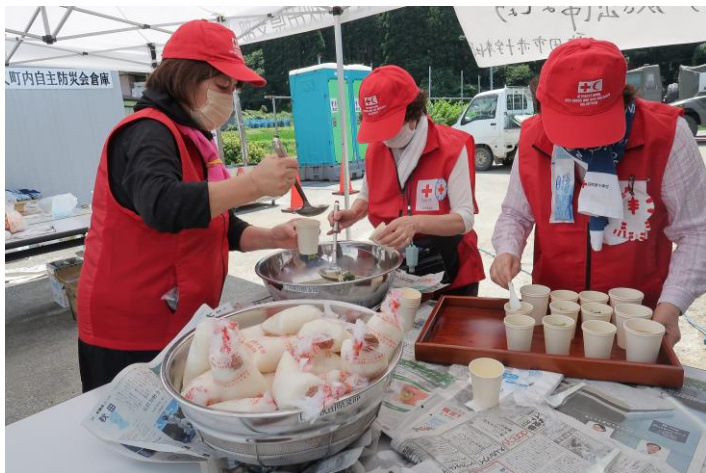
「被災された方に炊き出しを行う 赤十字ボランティア(秋田県五城目町)」