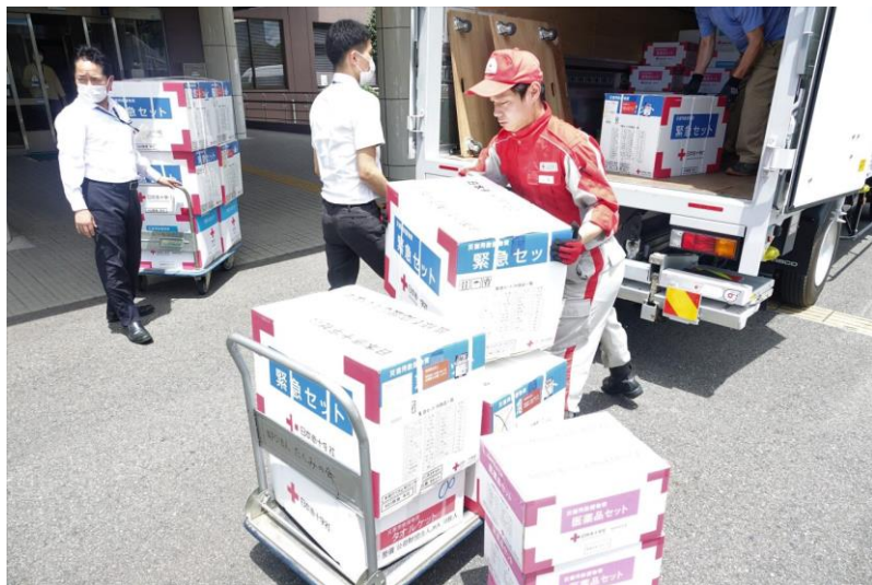
「自治体職員とともに救援物資の積み下ろしを行う日赤職員（福岡県久留米市）」