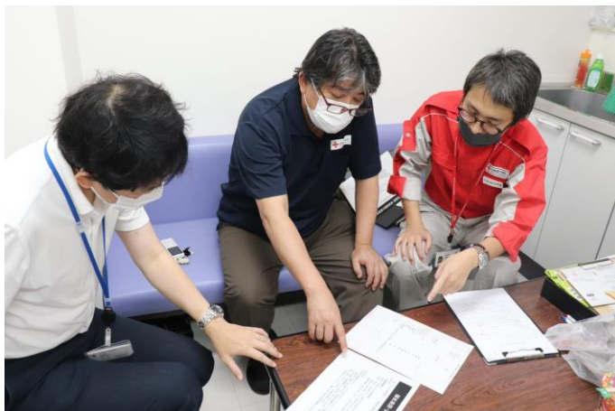
「被災医療機関の状況を確認する日赤災害 医療コーディネーターチーム(鳥取県鳥取市)」