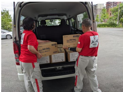
「支援物資をボランティアセンターに搬送する 赤十字ボランティア(佐賀県佐賀市)」