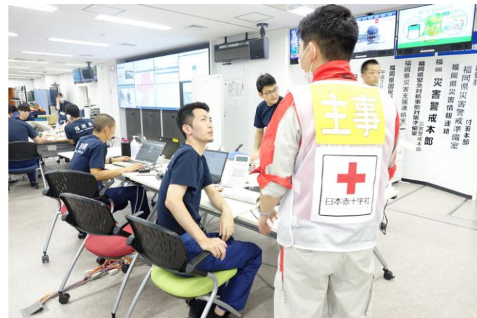
「県庁で情報収集を行う日赤職員 (福岡県福岡市)」