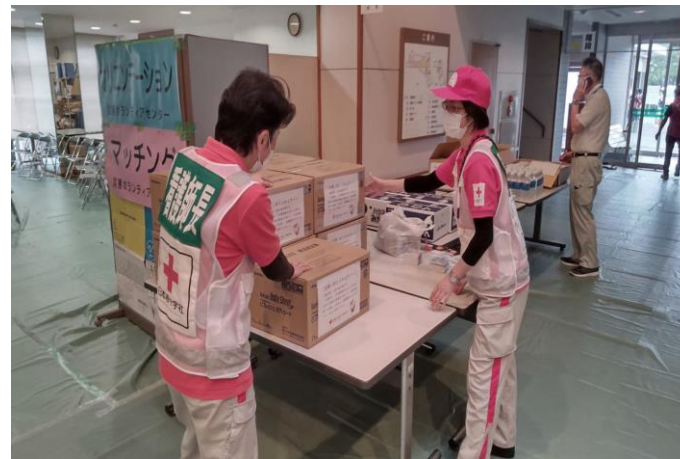
「ボランティアセンターで健康管理を 行う日赤看護師(佐賀県唐津市)」