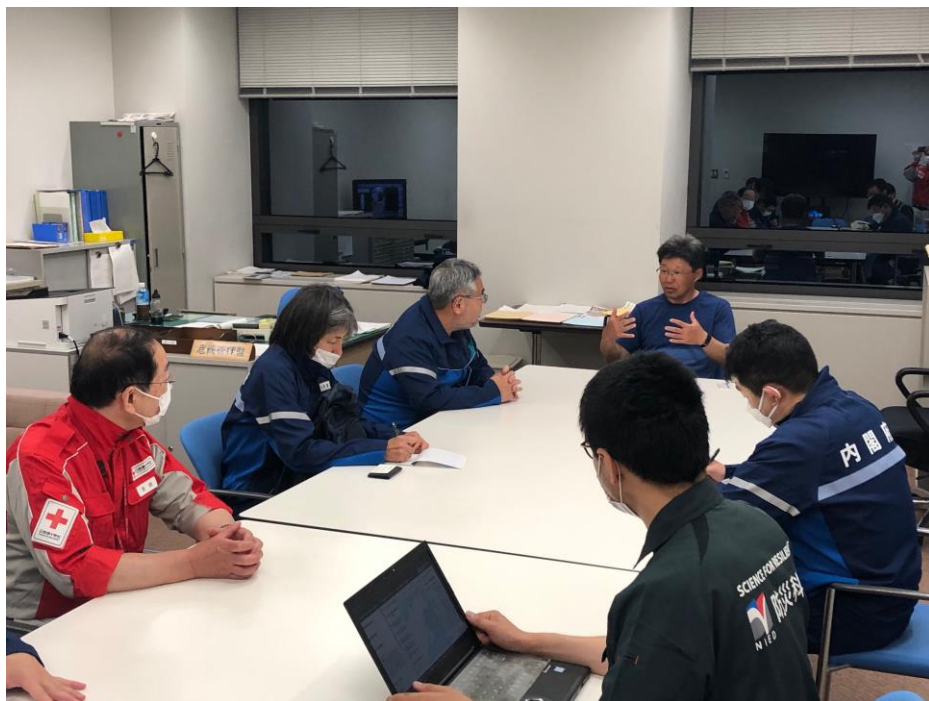
「石川県庁で内閣府調査チームの打合せに参加する日本赤十字社職員(石川県)」