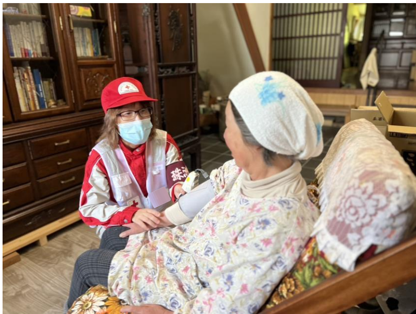
「被災地域の在宅避難者を戸別訪問する日赤看護師(石川県珠洲市)」