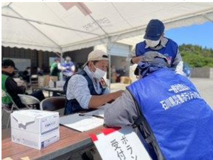
「ボランティアセンターの運営支援をする赤十字ボランティア(石川県珠洲市)」