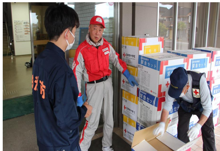
「珠洲市役所に救援物資を搬送する 石川県支部職員(石川県珠洲市)」