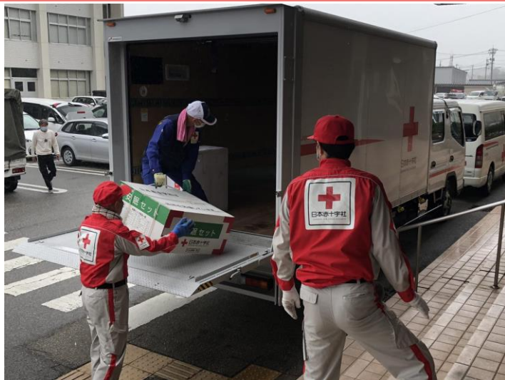
「救援物資を珠洲市役所に搬送する赤十字ボランティア(石川県珠洲市)」