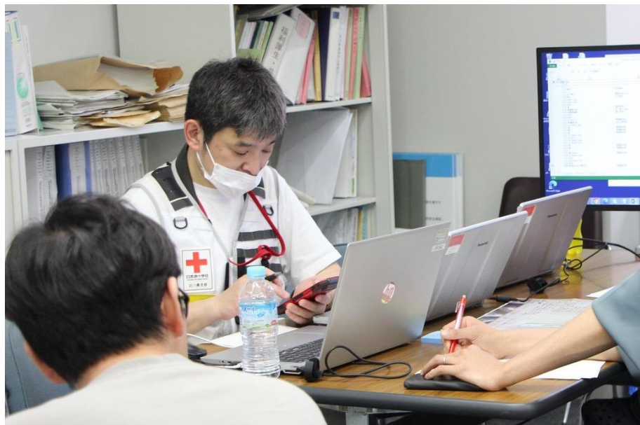
「石川県庁で情報収集する 石川県支部職員(石川県)」