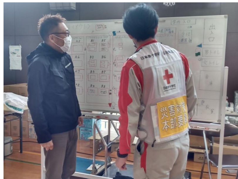
「避難所をアセスメントする石川県支部職員(石川県珠洲市)」