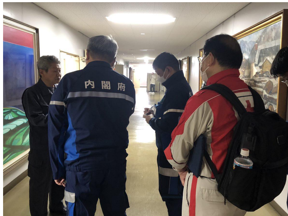
「珠洲市役所で内閣府調査チームの打合せに参加する日本赤十字社職員(石川県珠洲市)」