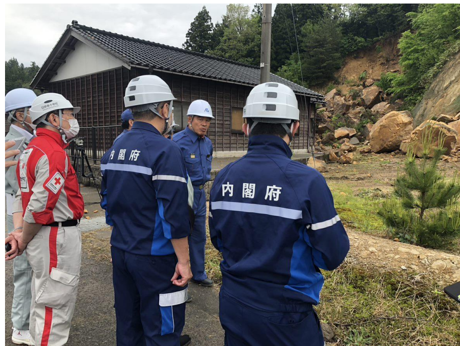
「知事の被災地視察に同行する日本赤十字社職員（石川県珠洲市）」