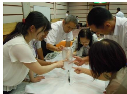
「ドローイングチャレンジ」