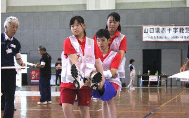
山口県鴻城高校チーム

JRC加盟高校からは2校・4チームのエントリーがあり、熱戦が繰り広げられました！