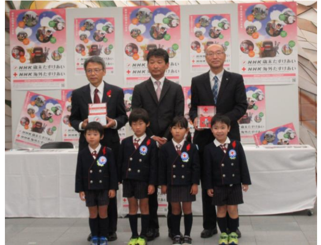
藤村学園旭幼稚園

12月2日、NHK山口放送局にてオープニングセレモニーを実施しました。藤村学園旭幼稚園の代表4名から、園内で集めた募金が「みんなで集めた募金です。使ってください」というメッセージとともに手渡されました。