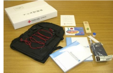
被災世帯へ配布される災害救援物資（毛布・緊急セット・学用品セット）