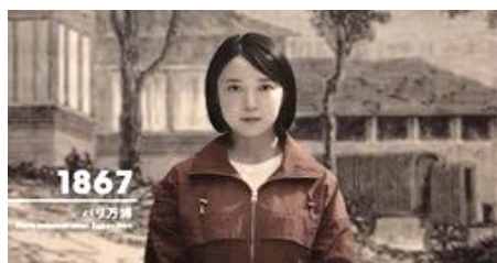
運動月間用CMの放映(2種)