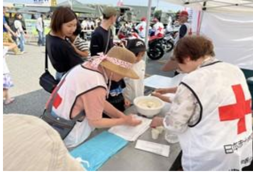
非常炊き出しの方法を学ぶ来場者