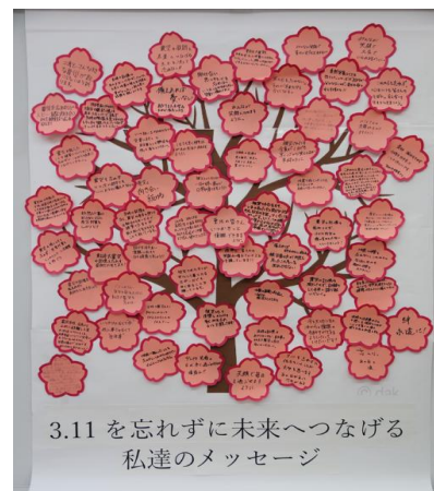
3.11を忘れずに未来へつなげる私達のメッセージ