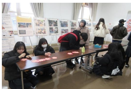
高校生一人ひとりが未来へのメッセージを綴った