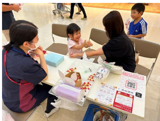
イオンモール「まちのおしごと体験」での 模擬採血体験の様子 (イオンモール山形南)