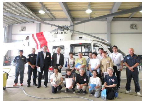
赤十字奉仕団視察研修(秋田県)で救護看護師についての資料やドクターヘリの見学を行った