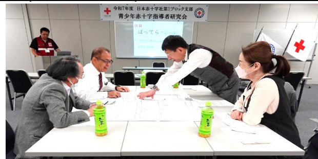
第1ブロック支部青少年赤十字指導者研究会の様子。防災をテーマにした公開授業と研修を行った。