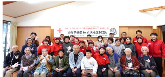
奉仕団と地域住民の記念撮影