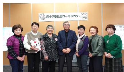
同じ地域の奉仕団同士で活動内容の情報交換などを行った