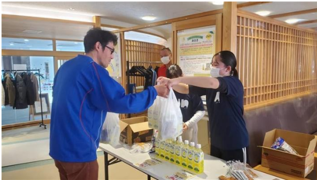
2025 山形 Make Lemonade プロジェクトの様子