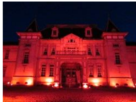
旧米沢高等工業学校本館