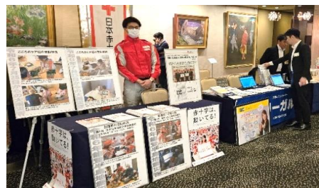
山形県司法書士総会で赤十字の展示ブースを出展した