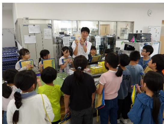
山形県赤十字血液センター施設見学の様子 (山形市立千歳小学校)