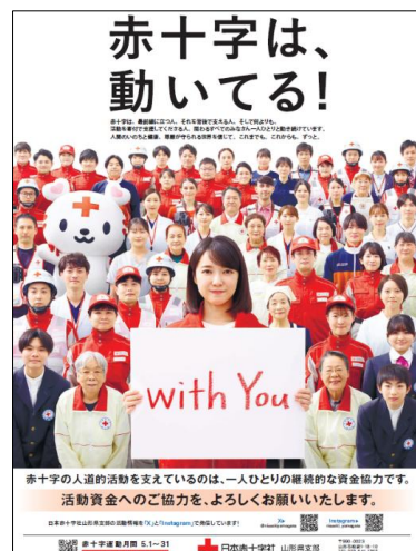
運動月間新聞広告の掲載