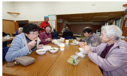
地域住民へ芋煮のふるまい