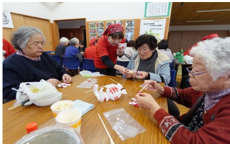
ハートラちゃんワッペンづくりをしながら交流