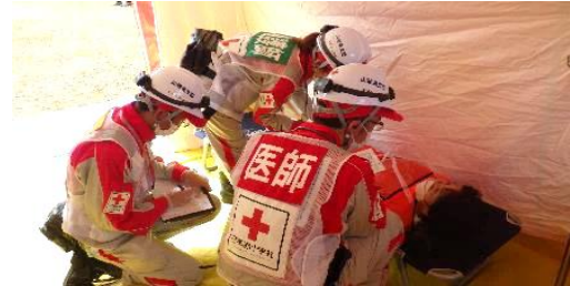
傷病者の状態に応じて処置を実施