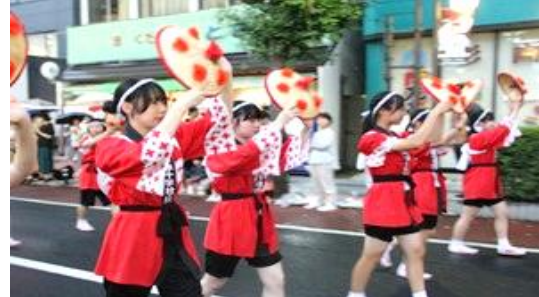
花笠パレード参加の様子