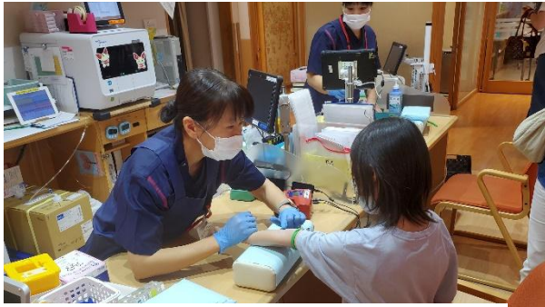
けんけつルーム親子で見学ツアーの様子