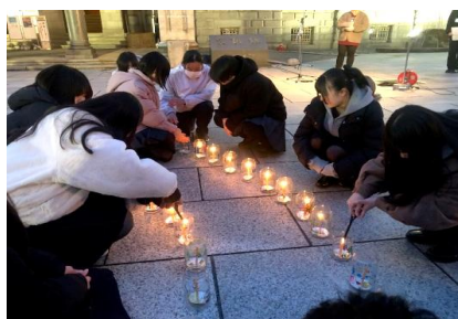
震災への思いを胸にキャンドルに火を灯す高校生