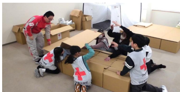
レッドクロスキッズやまがた