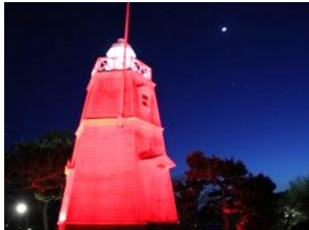
日和山公園木造六角灯台