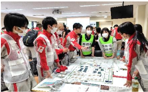
避難所アセスメント演習