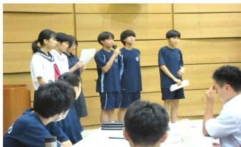
小・中学校リーダーシップ研修