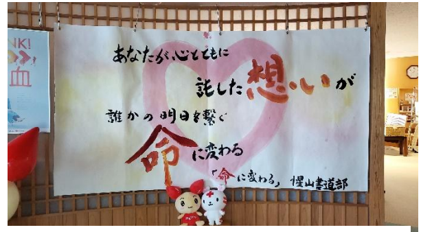
献血ルーム SAKURAMBO イメージソングをもとにした書道作品