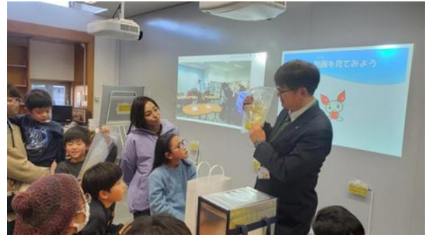
本の森講座 図書館で学ぼう！いのちを救う「けんけつ」のオンライン見学ツアーの様子