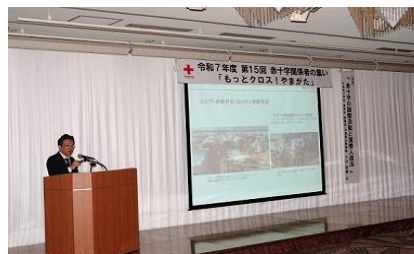
本社大山国際部次長の講演