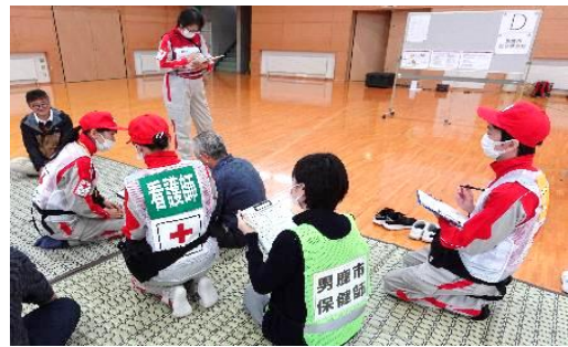
仮想避難所における巡回診療訓練