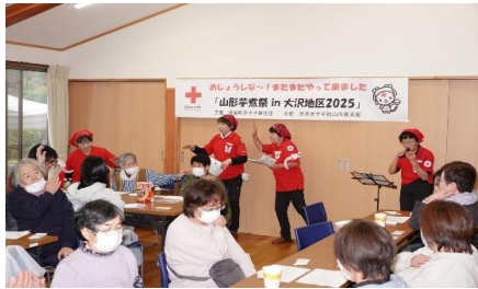
オカリナ演奏で一緒に歌いながら交流