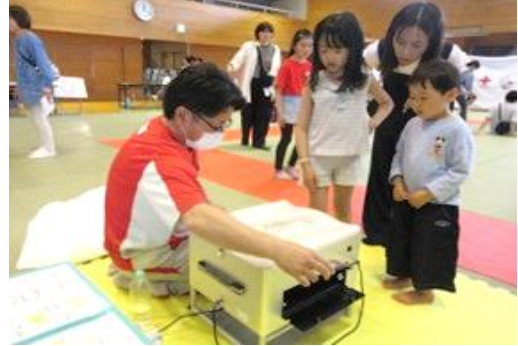
自動ラップ式簡易トイレの紹介を受ける来場者