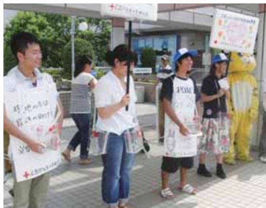
手作り看板で義援金募集