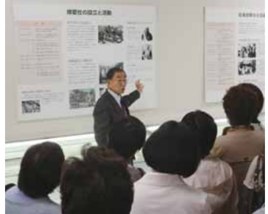
赤十字施設で見学者の案内をするボランティア