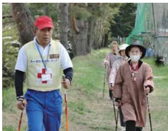
健康増進のためのノルディックウォーキング