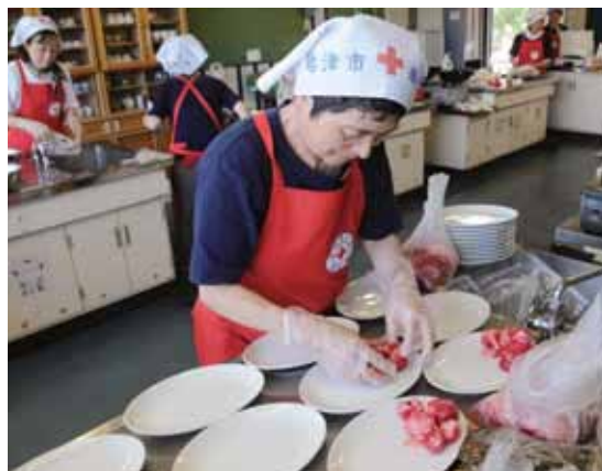
災害時の炊き出し準備