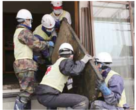
被災地家屋の畳上げ作業

● ● ● 赤十字ボランティアを対象とした保険制度もご用意しています。 ● ● ●