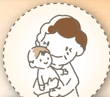
子どもの健全育成