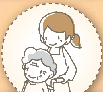
病院ボランティア