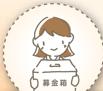
義援金・救援金募集