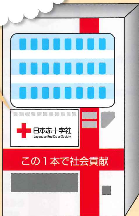
赤十字オリジナルデザイン