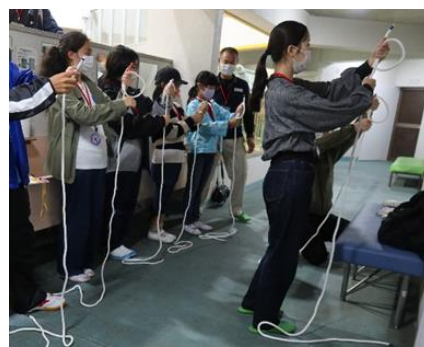
トレーニングセンターの運営支援