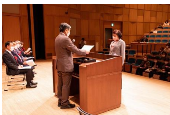
長年の功労が顕著な奉仕活動に対する有功章の贈呈