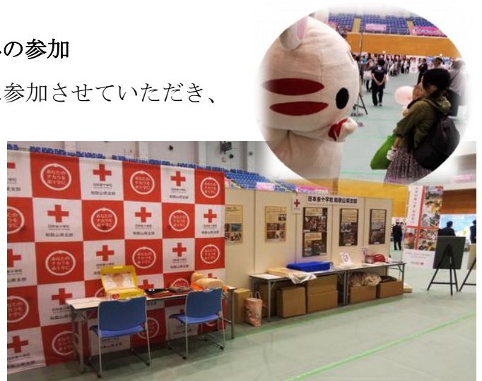
赤十字活動のパネルや救護物資の展示

日本赤十字社公式キャラクター「ハートラちゃん」とのふれあい、赤十字活動パネルの展示、救急法等の講習を通して、会場にいられた多くの方々へ向けた赤十字事業と活動資金募集のPRに努めます。