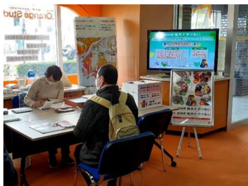
NHK和歌山放送局に設置された救援金受付窓口

当支部では、キャンペーンの期間中、NHK和歌山放送局の1階ロビーに受付窓口を設置するとともに、県内地域赤十字奉仕団が同一日に、各地域で啓発活動や街頭募金を実施してご協力を呼びかけます