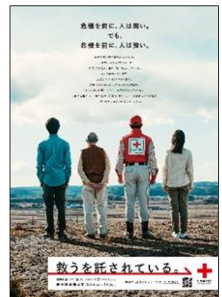
2022年度「広報ポスター」

また、大手スーパーの各店舗あてにも赤十字ポスターを送付して、店舗内に掲示していただくようお願いをします。