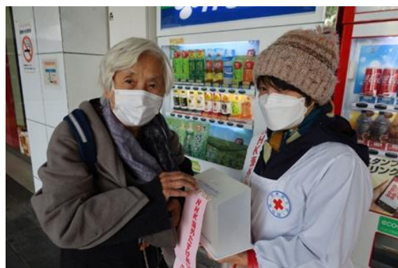
赤十字奉仕団員による啓発活動