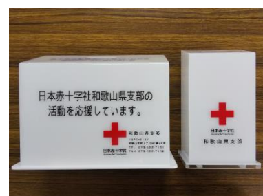
設置場所に合わせた2種の善意箱