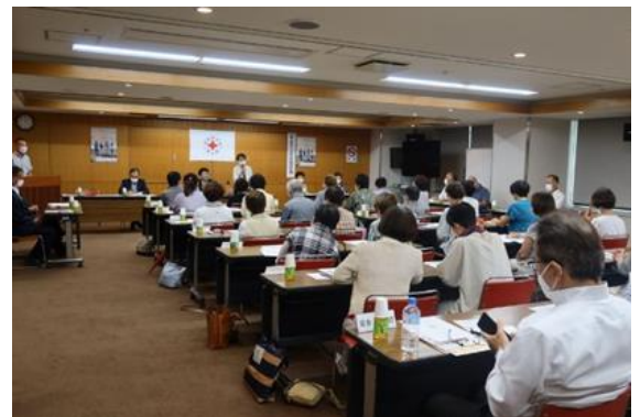
会議の前に行う奉仕団信条の唱和