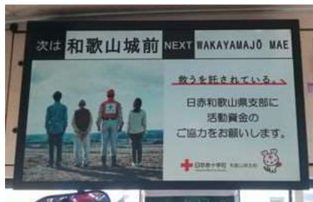
年間約87万回を放映(15停留所)

南海和歌山市駅や和歌山市内15ヶ所の停留所名をバス内で案内した後、音声放送及び映像広告を年間約87万回放映し、赤十字活動資金募集のPRを行いました。