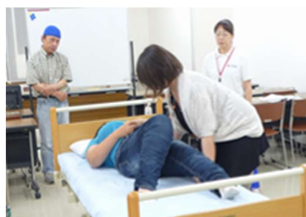
◇健康生活支援講習の実施状況◇

高齢者の支援、自立に向け役立つ介護技術や、高齢期を迎えた方にも役立つ健康維持の知識を習得する「健康生活支援講習支援員養成講習」及び講習の内容の一部を選択して講習時間を短縮した「健康生活支援短期講習」を実施しました。