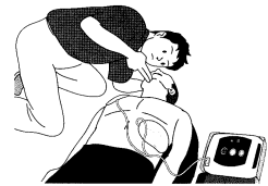
◇救急法講習の実施状況◇

不慮の事故や急病の発生に際し、直ちに手当が必要な傷病者に対する救命手当の方法（胸骨圧迫や人工呼吸の方法、AED（自動体外式除細動器）の使用方法）を習得する「救急法基礎講習」、医師に引き渡すまでに病状の悪化を防ぐための応急手当の方法（急病やけがの手当、搬送方法等）を習得する「救急法救急員養成講習」、及びこれら両講習の内容の一部を選択して講習時間を短縮した「救急法短期講習」を以下のとおり実施しました。