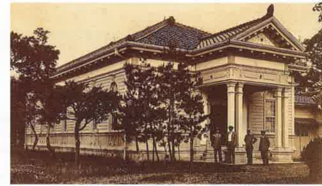
明治37年 富山県庁構内に竣工