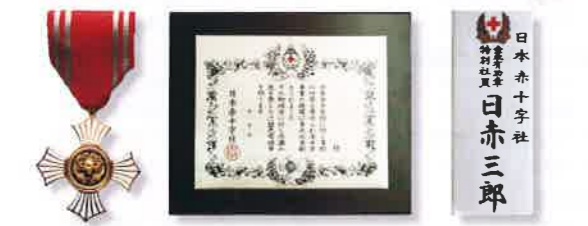
(個人: 金色有功章) (個人: 銀色有功章) (個人: 特別社員) (法人: 銀・金色有功章) (個人: 銀・金色有功章)