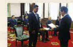
県庁特別室での伝達

(敬称略・五十音順) (平成30年4月1日から 平成31年3月31日までに受章された方) ※受章された方のご意向を確認して掲載しています