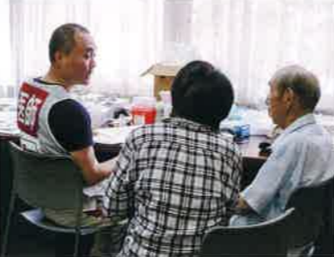
呉市安浦まちづくりセンターでの医療救護活動