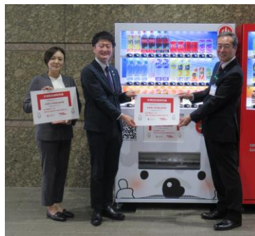
澤田グループでの自販機の設置 (R7.11)