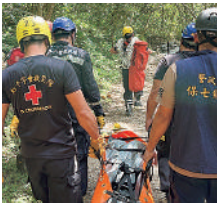
2024年台湾東部沖地震

▶紛争や災害、病気などに苦しむ人々を救うため、世界191の国と地域からなるネットワークを活かした人道支援活動を行っています。