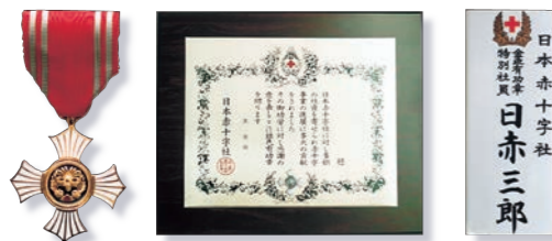
(個人:金色有功章) (個人:銀色有功章) (個人:特別社員) (法人:銀・金色有功章) (個人:銀・金色有功章)