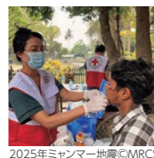
2025年ミャンマー地震