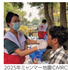
2025年ミャンマー地震