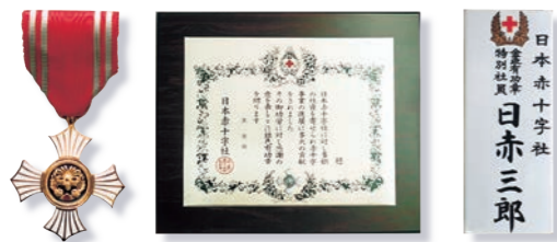
(個人:金色有功章) (個人:銀色有功章) (個人:特別社員) (個人:銀・金色有功章) (個人:銀・金色有功章)