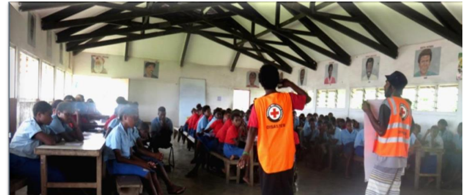
日本の青少年赤十字メンバーが集めた1円玉募金を国際開発事業における財源の一部とする