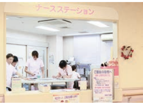
全員の連携で新しい命を守る

方法はありません。そのため、一旦発症したら、「いかに早く分娩にして、赤ちゃんを胎盤を子宮の中から出してあげるか」がポイントになります。