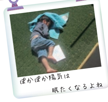
ぼかぼか陽気は 眠たくなるよね