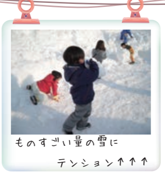
ものすごい量の雪に テンション↑↑↑