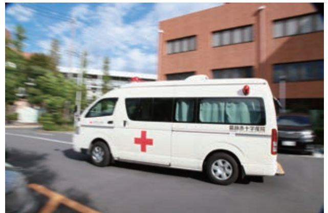
迅速な搬送で一人でも多くの命を救う