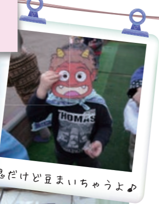
鬼だけど豆まいちゅうよ