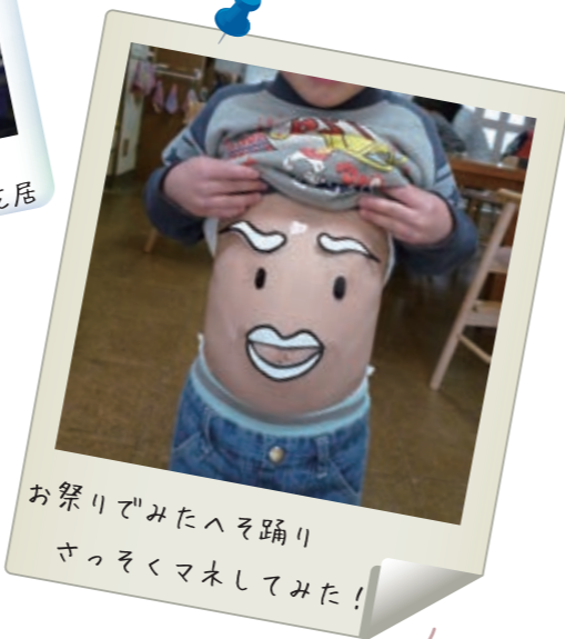
お祭りでもたへそ踊り さっそくマネしてみた!