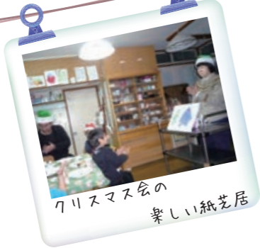
クリスマス会の 楽しい紙芝居