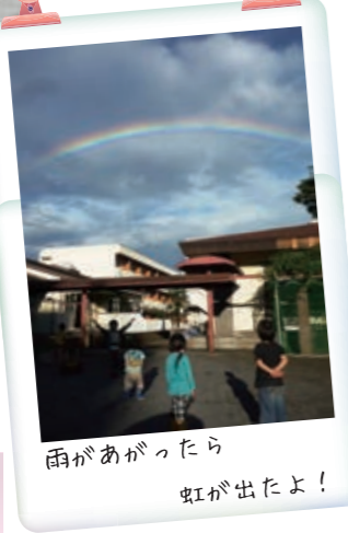
雨があがったら 虹が出たよ!