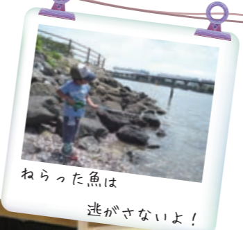
ねらった魚は 逃がさないよ!