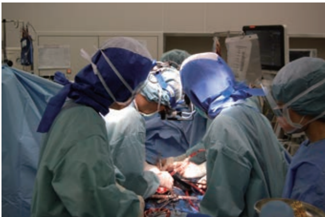
手術スタッフ一丸となって命を救う

大動脈疾患（大動脈瘤、大動脈解離） 大動脈瘤は動脈硬化によって弱くなった大動脈が部分的に徐々に太くなる病気で、破裂しない様に人工血管で置換します。一般的に破裂するまでは全く症状がないため、胸部レントゲン写真や他疾患での単純CT、腹部エコーで偶然発見されることがほとんどです。