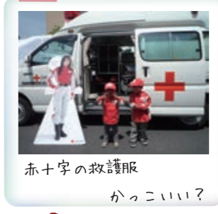
赤十字の救護服 かっこいい?