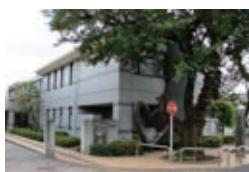
左：現施設の正門。かわいい看板がかかっている