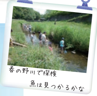
春の野川で探検 魚は見つかるかな