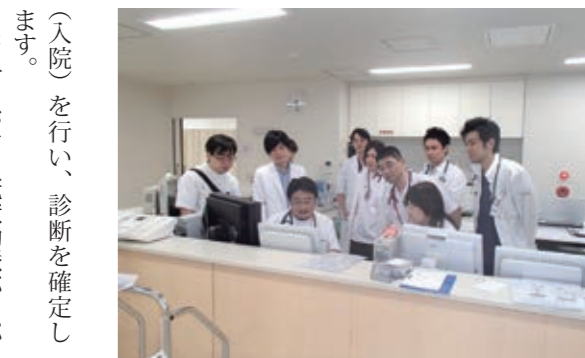
循環器内科との密接な連携（合同カンファレンス）

近年、手術を受ける高齢者が増えるにつれて、これら高齢者が抱える心臓以外のリスクにどこまで対応できるかが非常に重要な問題となっています。もともと抱える糖尿病、脳血管疾患、消化管疾患、慢性腎臓病を