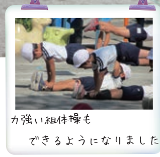
力強い組体操も できるようになりました