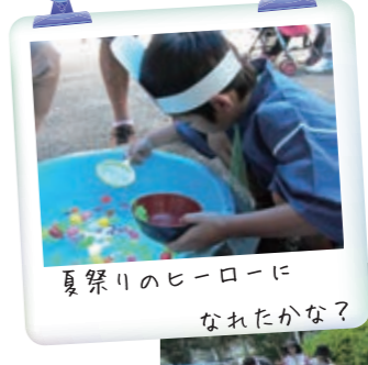
夏祭りのヒーローに なれたかな?

【事務局注】 写真の子どもの顔がほぼ写っていない理由 子ども達が子供の家に来る理由は様々です。時には身を隠さなければならない状況もあるため、福祉施設として各種情報の管理には十分な注意を払わなければなりません。子ども達が満面の笑顔で写っている写真は多数あるのですが、本誌への掲載はそうした理由によりできないことをご理解ください。