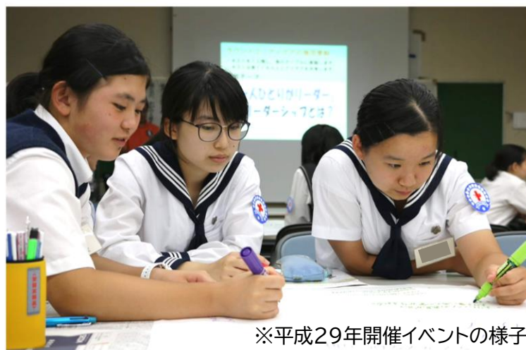
※平成29年開催イベントの様子

どんなことでも、誰かのために自分が できることがあるんだと気付くことが できました。これからは“人のために” という視点からも物事を考えられる人 になろうと思います。