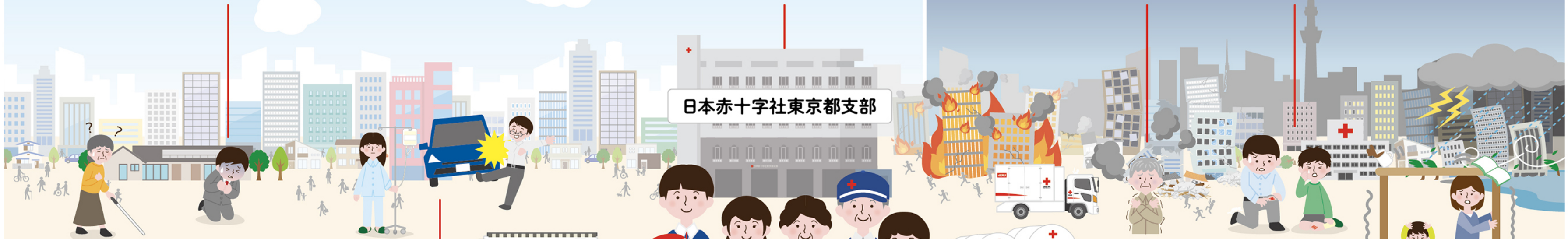
ケガや病気をされた方の診療