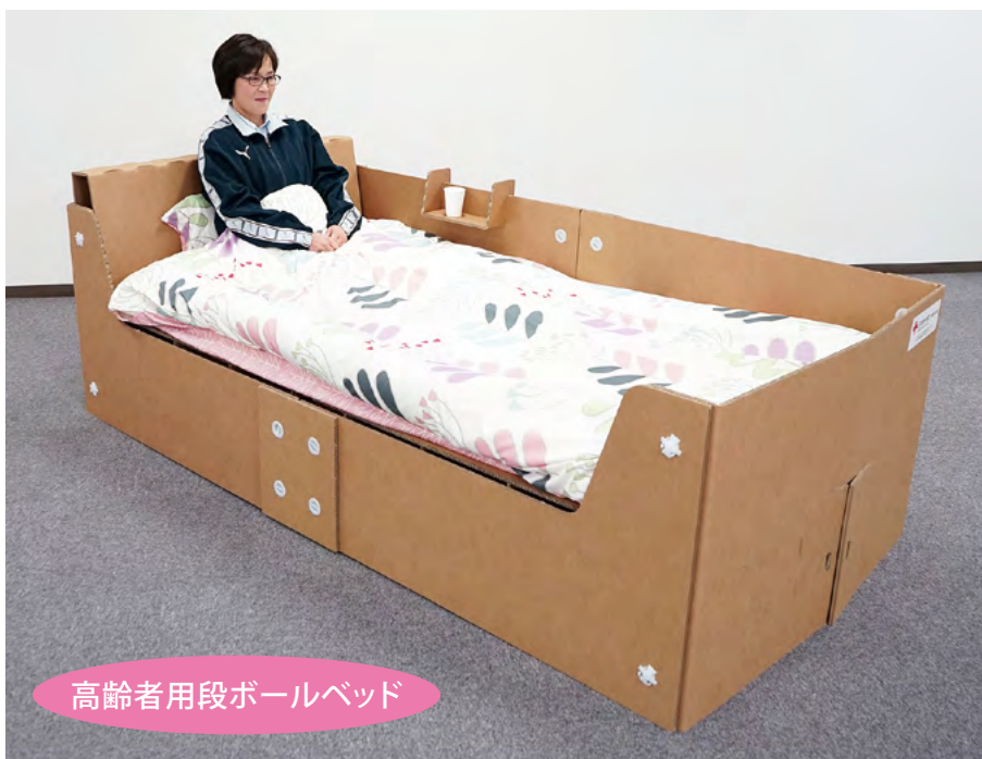
高齢者用段ボールベッド

今後は、当支部ですでに備蓄している長期避難所生活でのエコノミークラス症候群を予防する「弾性ストッキング」と併せて、地域での「体験型防災・減災講習会」にも活用する予定です。