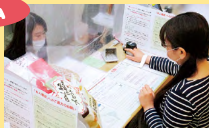
受付や問診室には飛沫防止シートを設置