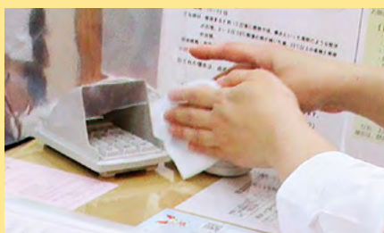
機材やイス等の消毒、間隔をあけた待合スペースの確保