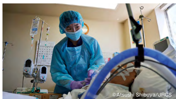
●感染症指定医療機関となっている武蔵野赤十字病院で 患者のケアにあたる看護師