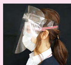
●フェイスシールドの特徴 ●超軽量 ●医療用ゴーグルや眼鏡の上から装着可能 ●曇らず、透明性が高い ●視界が歪まず、長時間使用しても疲れない