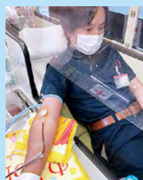
飛沫防止シートの設置

[その他] ●献血者及び職員のマスク着用 ●職員の健康チェック ●職員の手指消毒 など