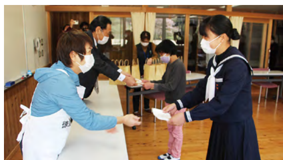
●お手製マスクを贈呈する地域赤十字奉仕団員

また、地域では、地域赤十字奉仕団が高齢者や子供たちのために手作りマスクを作製し配布するなど、県内各地で赤十字精神に基づく活動の輪が広がっています。