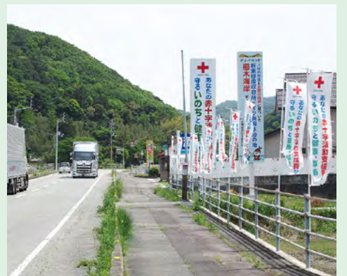
●鳴門市北灘町に設置された赤十字のぼり

鳴門市北灘町では地元の方々のご協力により、国道11号線沿いに赤十字のぼりを多数設置。五月の爽やかな風に赤十字マークがなびき、通行するドライバーや歩行者の方々に赤十字を躍動的にPRしました。また、徳島駅前一番町商店街では、昨年引き続き、赤十字フラッグキャンペーンを実施しました。