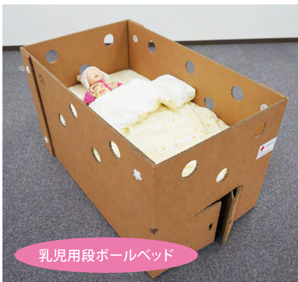
乳児用段ボールベッド