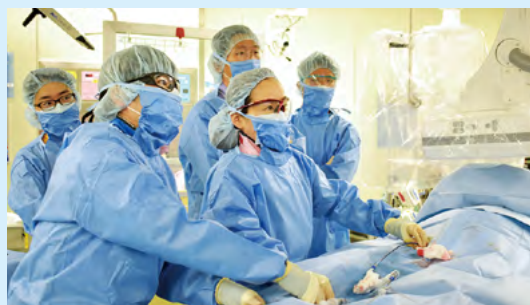
●【写真2】心臓の卵円孔を開鎖するカテーテル治療の様子