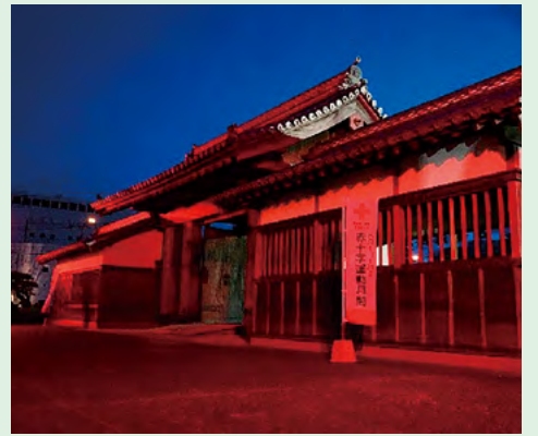
●ライトアップされた徳島中央公園「鷺の門」

5月8日から14日までの間、徳島県の象徴的な建造物として親しまれている徳島中央公園「鷺の門」を、赤く照らす「レッドライトアッププロジェクト」を実施。赤十字カラーで幻想的に照らされた鷺の門を多くの方にご覧いただくことで、赤十字に思いを寄せていただくとともに、活動への理解と協力を呼びかけました。