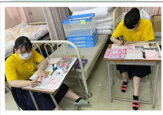
脇町高等学校(美馬市)

地域への訪問活動が出来ない中で、美馬市内の米寿を迎える市民227名に、お祝いメッセージカードを作成しました。