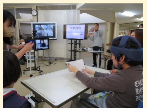
鴨島支援学校(吉野川市)

市役所内に作品配布コーナーを設置し、制作したエコバッグ等を地域住民に届けています。市民からの応援やお礼の言葉を聞き、地域とのつながりを実感しています。