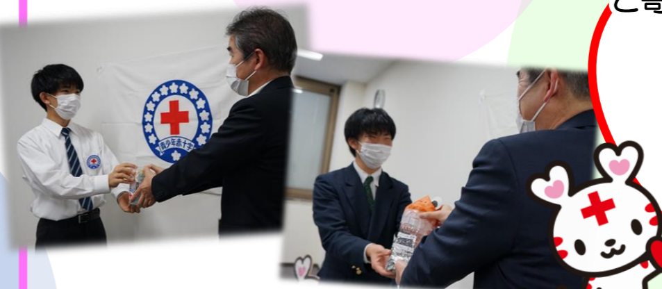
徳島中央高等学校(徳島市)