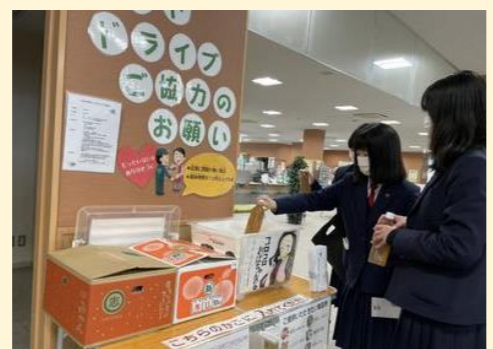
名西高等学校(石井町)

市役所内に作品配布コーナーを設置し、制作したエコバッグ等を地域住民に届けています。市民からの応援やお礼の言葉を聞き、地域とのつながりを実感しています。