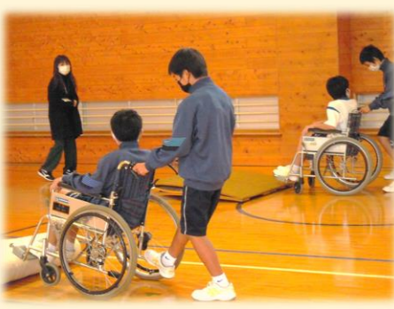
ひのみね支援学校(小松島市)