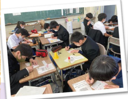
津田中学校(徳島市)

地域への訪問活動が出来ない中で、美馬市内の米寿を迎える市民227名に、お祝いメッセージカードを作成しました。