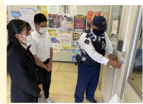
那賀高等学校(那賀町)

地域のこども食堂の応援で、校内でフードドライブを行いました。食品回収の意義を校内に広げ、より活発に活動を続けていきます。