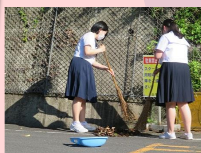
山城中学校(三好市)

児童・生徒が協力しながら学校周辺や地域の清掃活動を行っています。清掃範囲がすっきりと綺麗になることで活動に達成感が芽生え、地域貢献をしていると実感します。 また、清掃活動によって災害時の避難経路の確保につながり、地域の防災にも貢献しています。