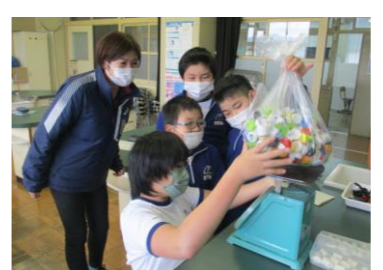
三島小学校(美馬市)