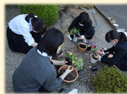
つるぎ高等学校(つるぎ町)

学校周辺や最寄り駅の清掃活動、校内の花の寄せ植えを行っています。 感染症拡大によりボランティア活動が制限されていますが、美化活動で地域貢献をしていきます。