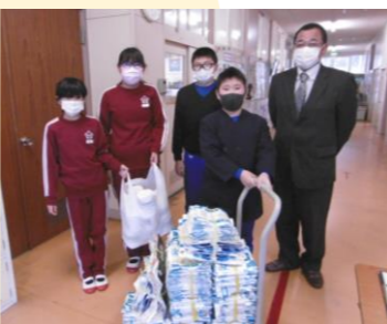
江原北小学校(美馬市)