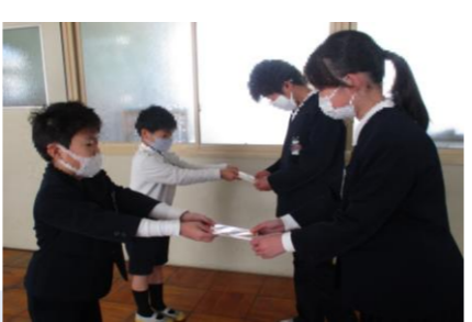
北井上小学校(徳島市)