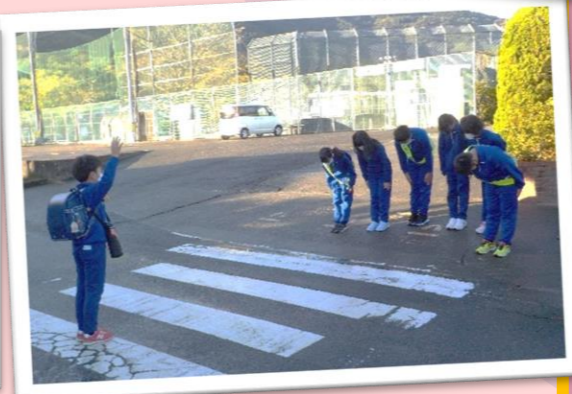
川島小学校(吉野川市)