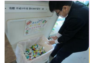
山瀬小学校(吉野川市)