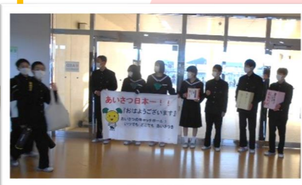
阿南第一中学校(阿南市)