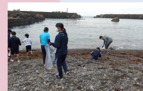
伊座利小学校・由岐中学校伊座利分校(美波町)