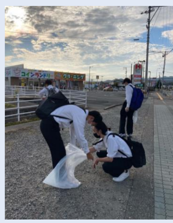
鳴門渦潮高等学校(鳴門市)