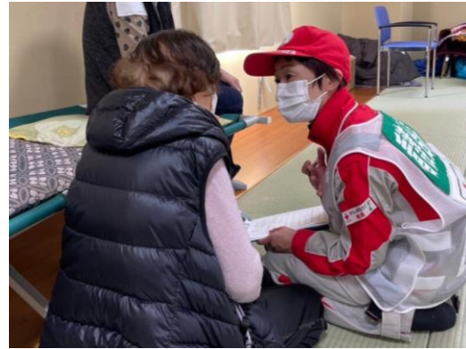
避難者に耳を傾けるこころのケア班