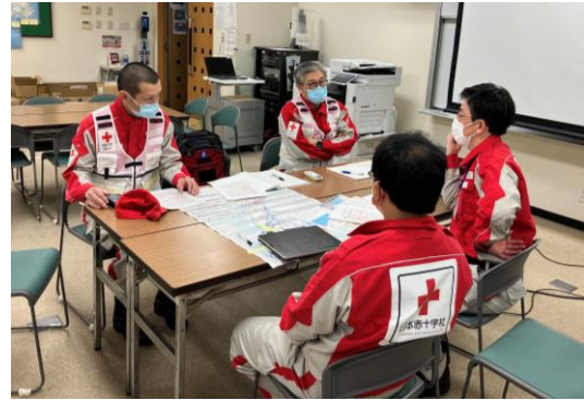
石川県支部コーディネーターとミーティングを行う徳島県支部コーディネートチーム