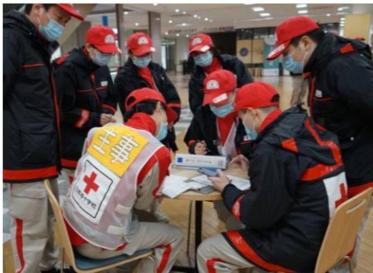
避難所訪問前に避難者の健康状態を確認する救護員