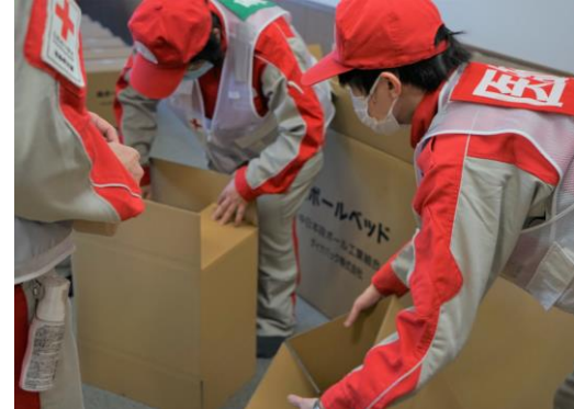
避難所の衛生環境改善のため、段ボールベッドの組立を行う様子