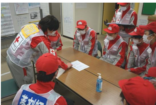
石川県支部で状況説明を受ける 徳島県支部救護班