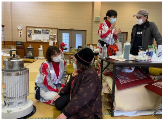
避難者の声に耳を傾げるこころのケア班