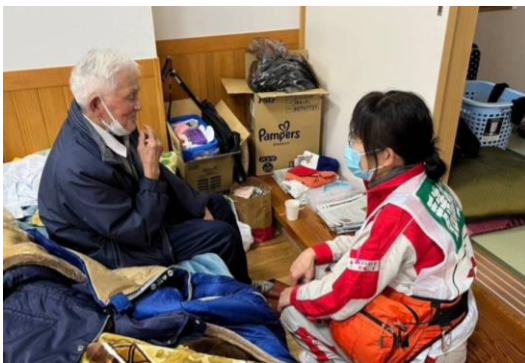
避難者の話を傾聴するこころのケア班