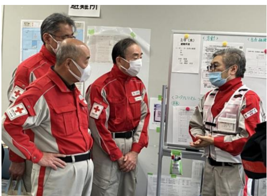
日本赤十字社社長（写真中央）に医療調整本部の活動内容を説明する徳島県支部コーディネーター