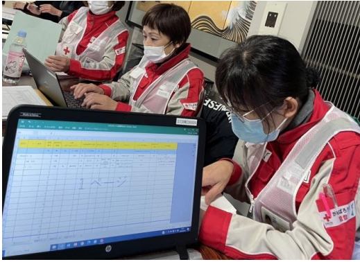
記録作成業務を行うこころのケア班