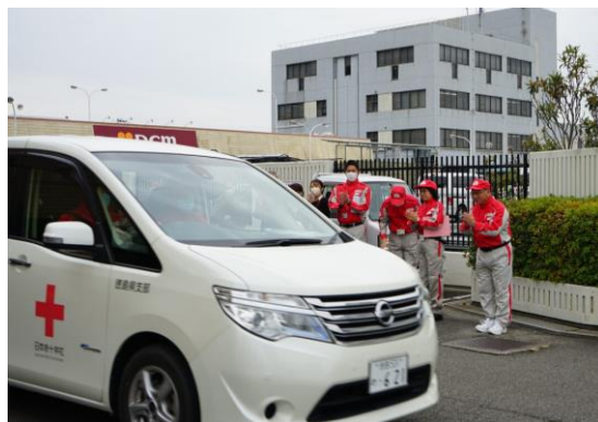
救護車両1台に乗り込み 出発するコーディネーターチーム