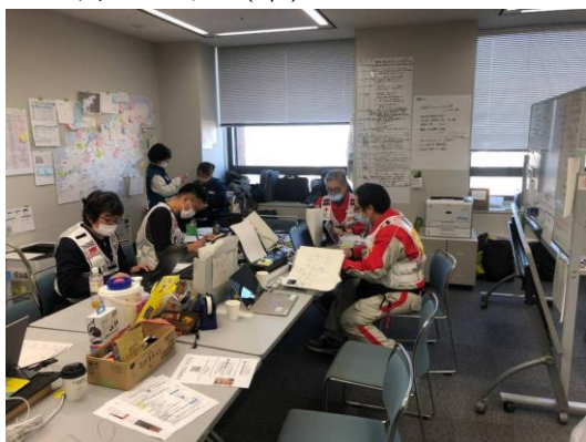
石川県保健医療福祉調整本部で活動する 徳島県支部コーディネーターチーム