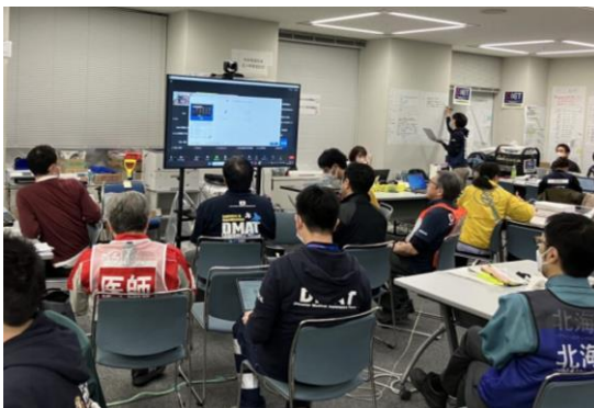
関係機関との会議に参加する徳島県支部コーディネートチーム