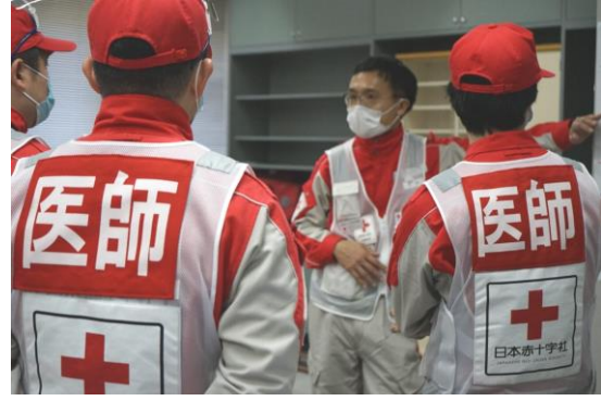
避難所対応本部を立ち上げる救護員