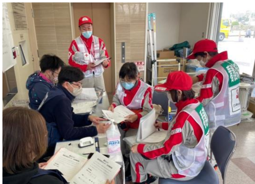
ミーティングを行うこころのケア班