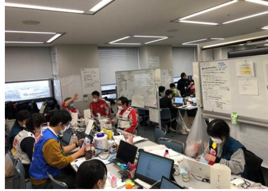
石川県保健医療福祉調整本部で活動する徳島県支部コーディネートチーム