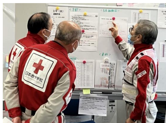
赤十字の災害救護体制を説明する様子