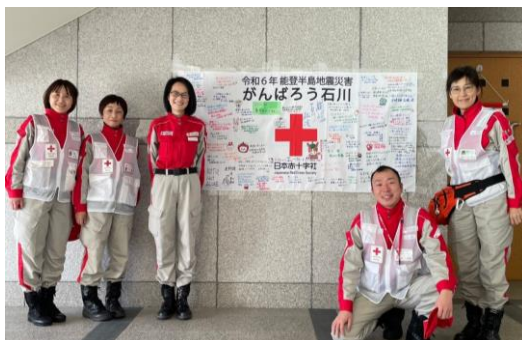
こころのケア班（四国チーム）として派遣された徳島・高松・高知・松山赤十字病院の看護師等