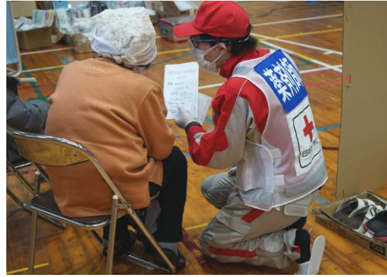
処方薬の説明を行う薬剤師