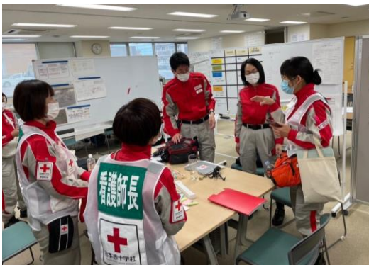
ミーティングを行うこころのケア班