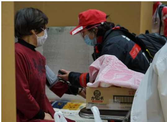
血圧測定を行う看護師