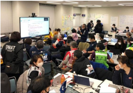
関係機関との会議に参加する徳島県支部コーディネートチーム