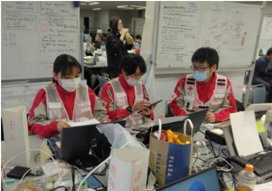
後続のチームに業務の引き継ぎを行う徳島県支部コーディネートチーム