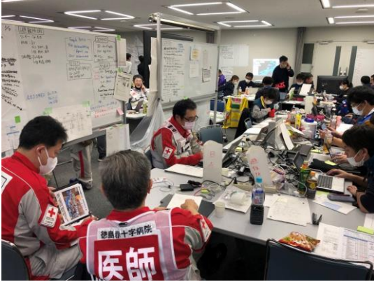
各関係機関と連携し、コーディネート業務等を行う徳島県支部コーディネートチーム