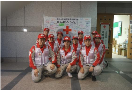
医療救護班 (第2班) として派遣された10名