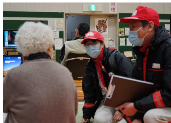
避難者の不安を傾聴する救護員