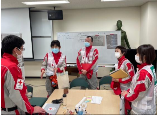
ブリーフィングを行うこころのケア班