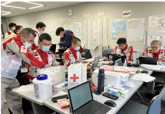
業務の引き継ぎを受ける徳島県支部コーディネートチーム