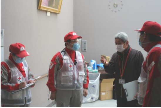
地元のコーディネーターから話を聞く救護員