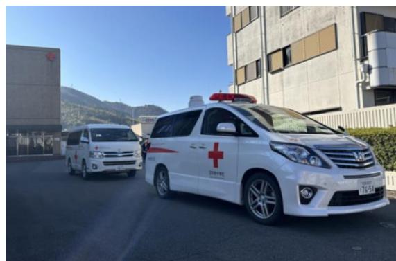
救護車両2台に乗り込み、出発する救護班