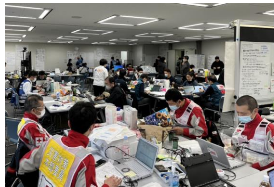
各関係機関と連携し、コーディネート業務等を行う徳島県支部コーディネートチーム