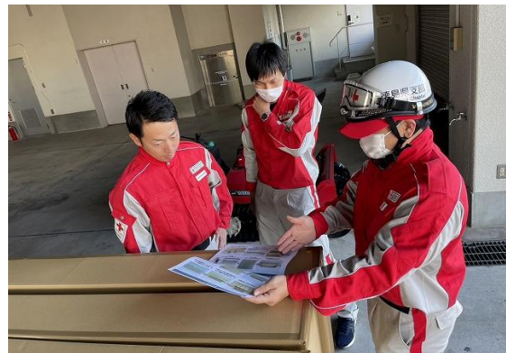
石川県支部職員に段ボールベッドの取り扱いを説明する当支部救護員