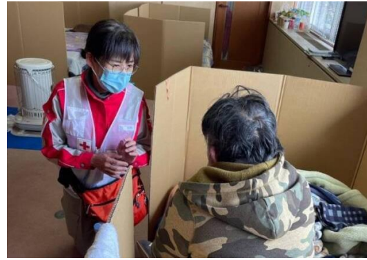
避難者に寄り添い、話を聞くこころのケア班