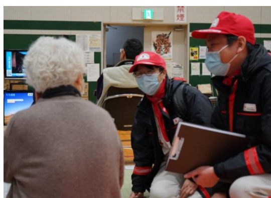
避難者の不安を傾聴する救護員