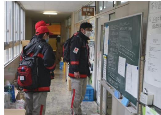
避難所の衛生環境を確認する救護班 (和倉小学校)