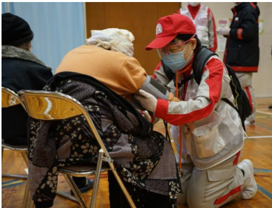
避難者の体調確認を行う看護師