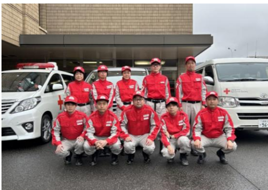
医療救護班 (第1班) として派遣された10名