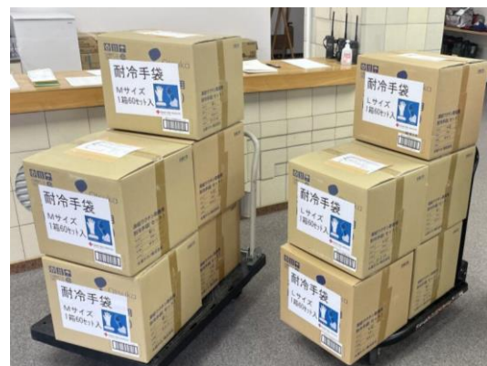
寒冷地での救護活動に活用されます