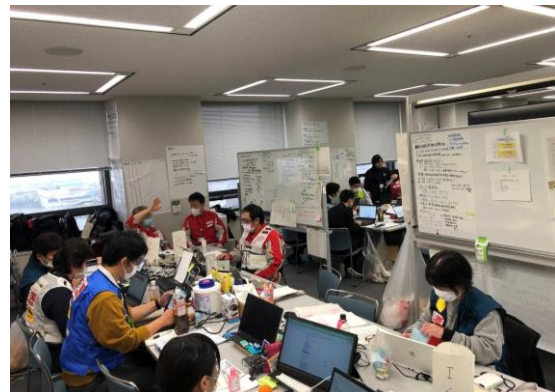
石川県保健医療福祉調整本部で活動する 徳島県支部コーディネートチーム