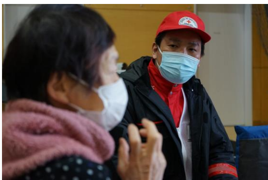
避難者の不安を傾聴する救護員