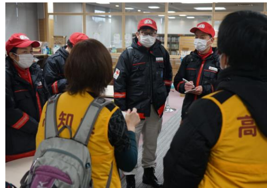
避難所の状況について保健師と確認する徳島県支部救護班