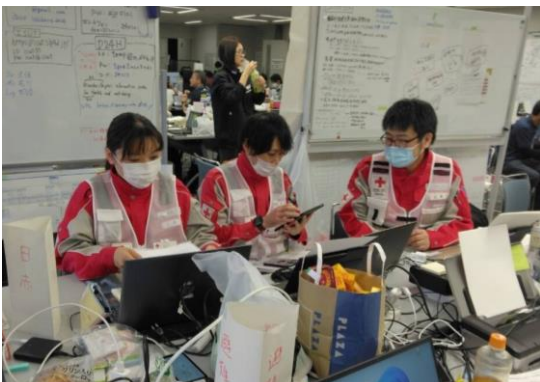
後続のチームに業務の引き継ぎを行う 徳島県支部コーディネートチーム