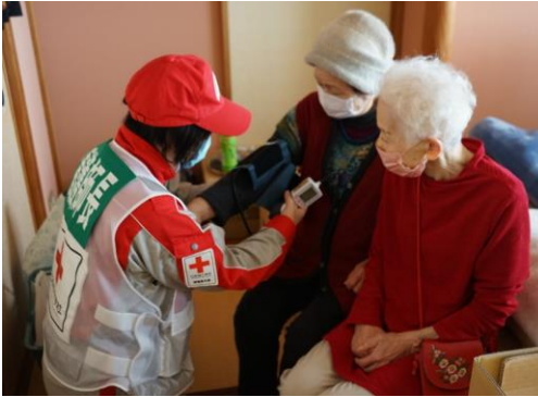
避難者の健康管理を行う看護師 (富来活性化センター)