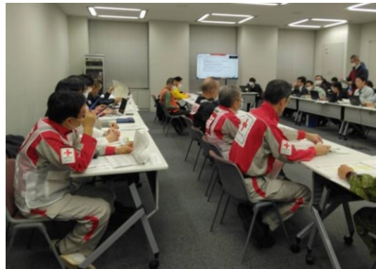
各関係機関との会議の様子