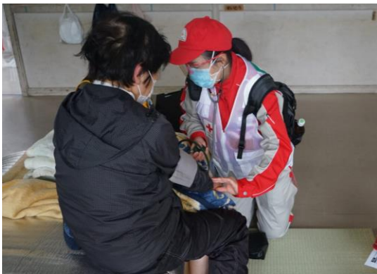
避難者の体調確認を行う救護員