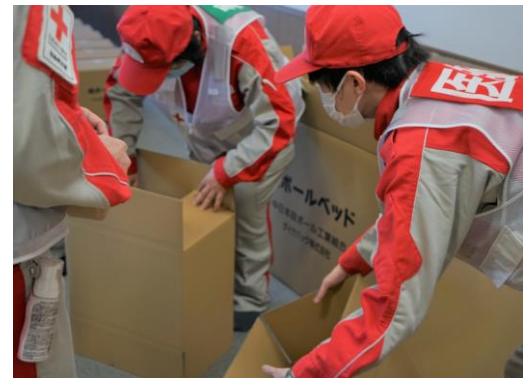
避難所の衛生環境改善のため、段ボールベッドの組立を行う様子