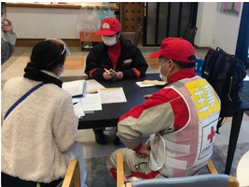
業務の引き継ぎを受ける徳島県支部救護班 (感染症患者待機施設)