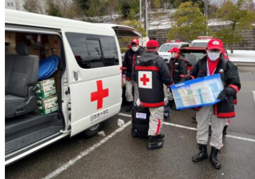
活動場所に向けて、物資を準備する徳島県支部救護班