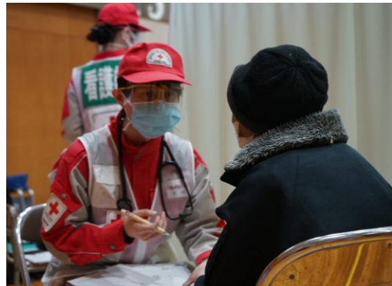
避難者の診察を行う医師