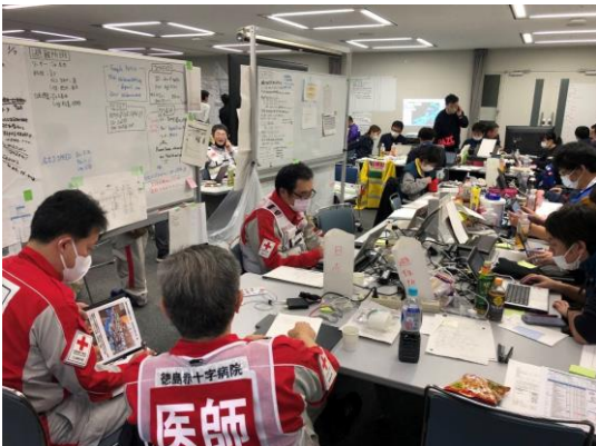
各関係機関と連携し、コーディネート業務等 を行う徳島県支部コーディネートチーム