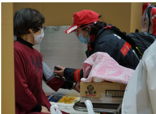
血圧測定を行う看護師