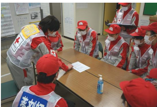
石川県支部で状況説明を受ける 徳島県支部救護班