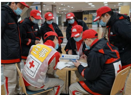
避難所訪問前に避難者の健康状態を確認する救護員