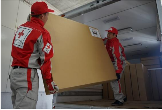
徳島県支部の救護倉庫で、段ボールベッドを積み込む救護員