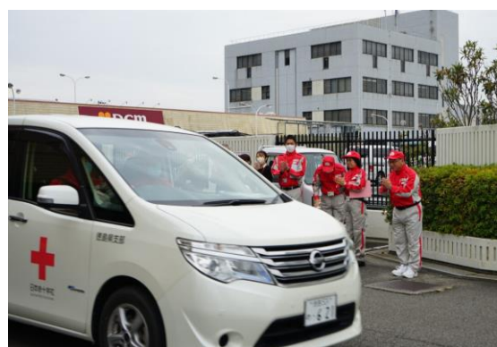
救護車両1台に乗り込み 出発するコーディネーターチーム