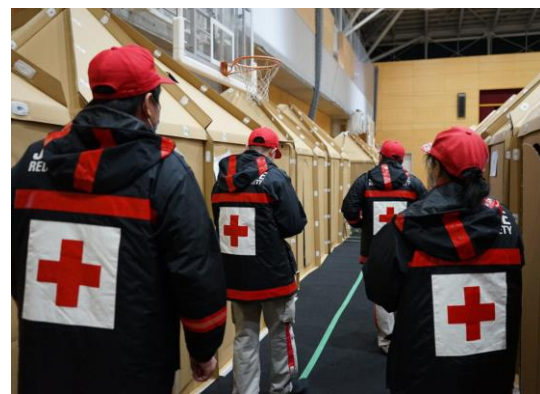
診療する避難者のもとに向かう救護員