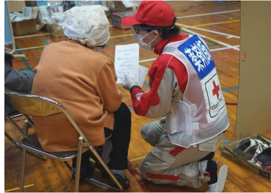
処方薬の説明を行う薬剤師