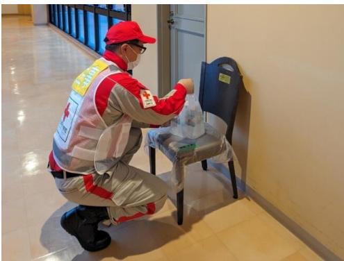
感染症患者に物資を届ける救護員 (志賀町・感染症患者待機施設)