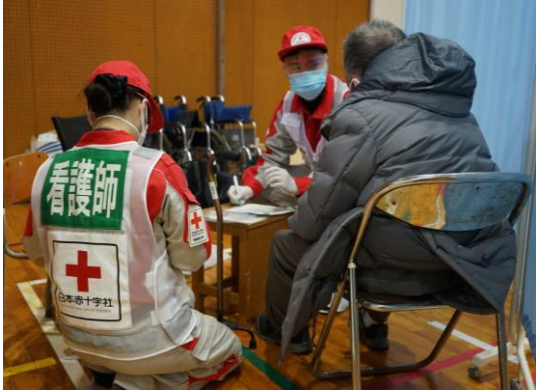
避難所の一角で診療を行う救護員