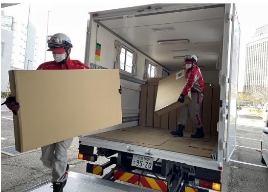
石川県の赤十字施設に段ボールベッドを搬入する徳島県支部の救護員