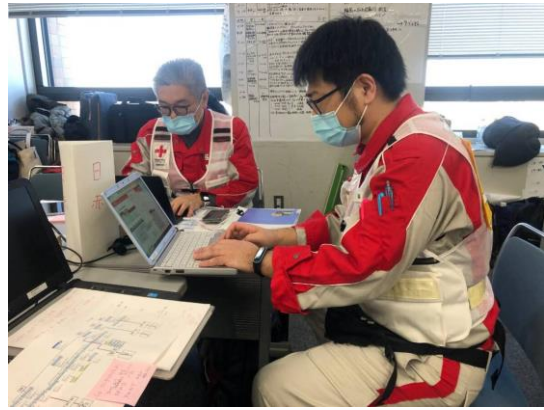
各種本部会議や避難所アセスメント等の資料 作成を行う徳島県支部コーディネートチーム