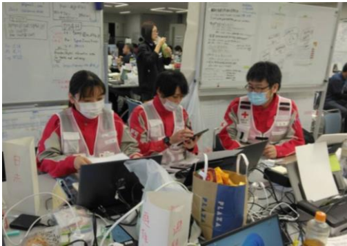
後続のチームに業務の引き継ぎを行う 徳島県支部コーディネーターチーム