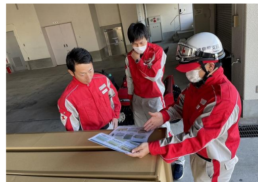
石川県支部職員に段ボールベッドの取り扱いを説明する当支部救護員