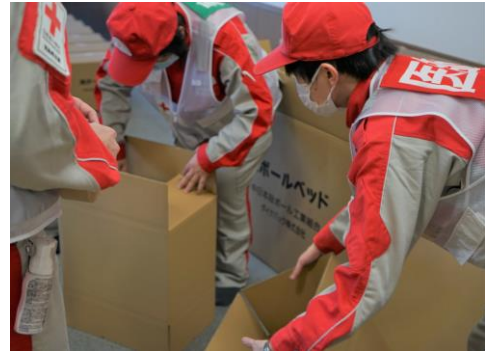
避難所の衛生環境改善のため、段ボールベッドの組立を行う様子