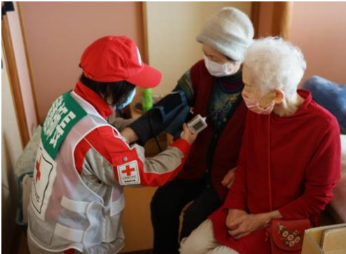
避難者の健康管理を行う看護師（富来活性化センター）