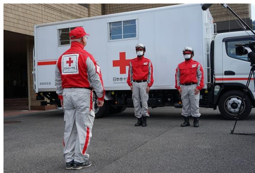
石川県支部に向けての出発式