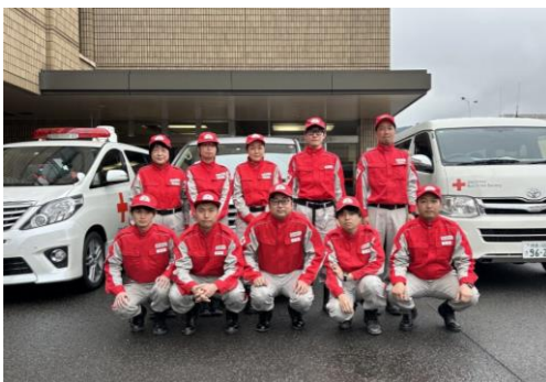
医療救護班 (第1班) として派遣された10名