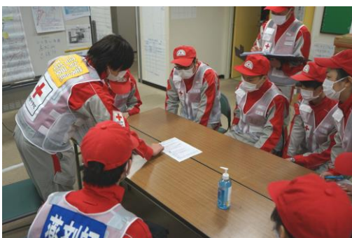
石川県支部で状況説明を受ける 徳島県支部救護班