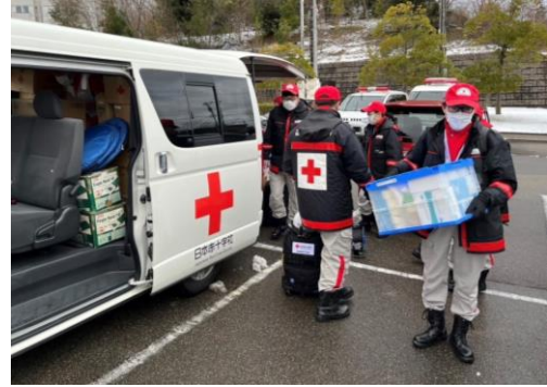
活動場所に向けて、物資を準備する徳島県支部救護班