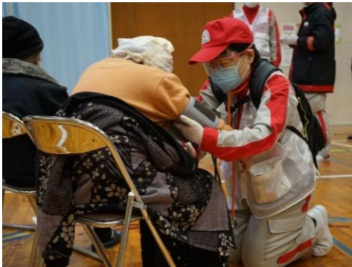
避難者の体調確認を行う看護師