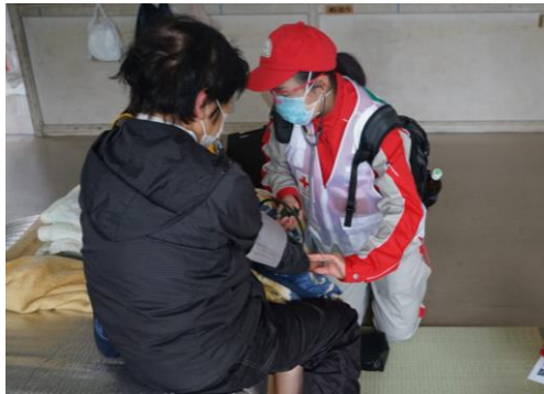
避難者の体調確認を行う救護員