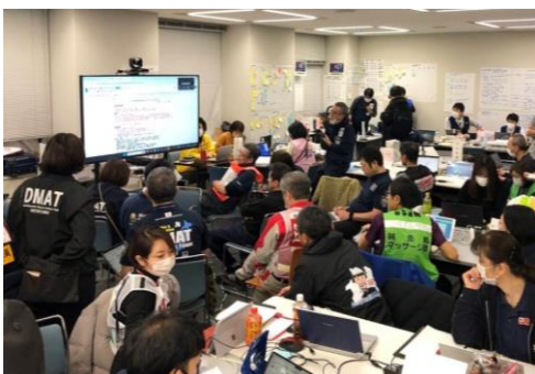
関係機関との会議に参加する徳島県支部 コーディネートチーム