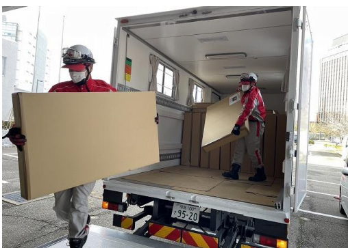
石川県の赤十字施設に段ボールベッドを搬入する徳島県支部の救護員