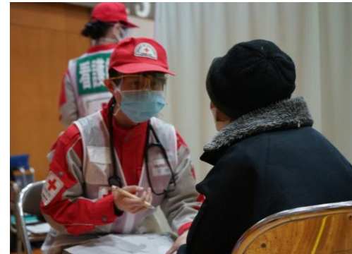
避難者の診察を行う医師