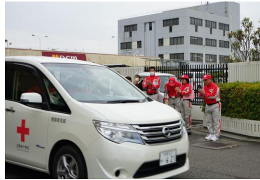
救護車両1台に乗り込み 出発するコーディネートチーム