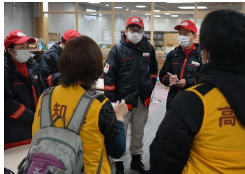
避難所の状況について保健師と確認する徳島県支部救護班