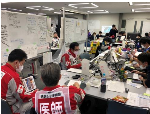
各関係機関と連携し、コーディネート業務等 を行う徳島県支部コーディネートチーム