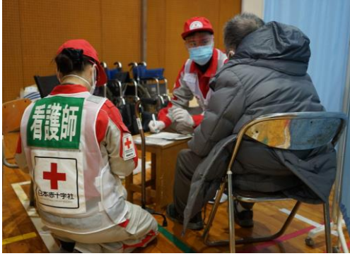
避難所の一角で診療を行う救護員