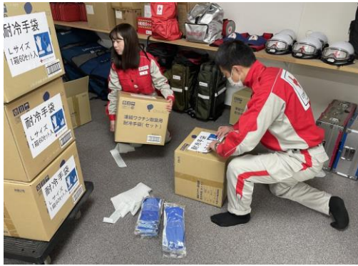
耐冷手袋の発送作業を行う 救護員（徳島県支部）