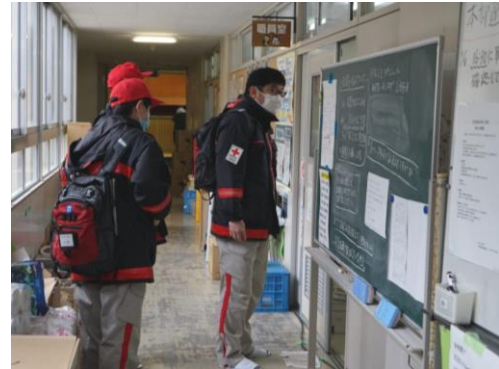
避難所の衛生環境を確認する救護班（和倉小学校）