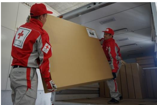
徳島県支部の救護倉庫で、段ボールベッドを積み込む救護員