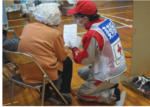
処方薬の説明を行う薬剤師