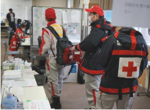
能登医療圏活動拠点本部に到着報告する救護班（能登総合病院）