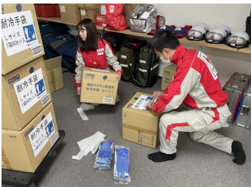
耐冷手袋の発送作業を行う 救護員 (徳島県支部)