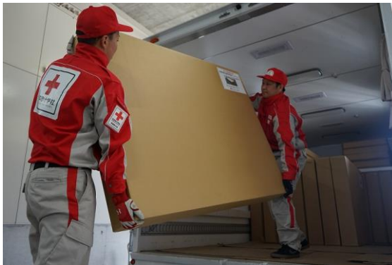
徳島県支部の救護倉庫で、段ボールベッドを積み込む救護員