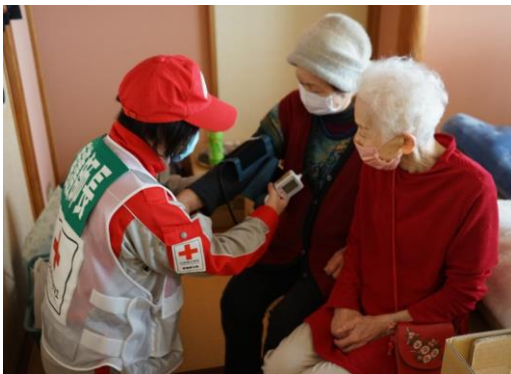
避難者の健康管理を行う看護師 (富来活性化センター)