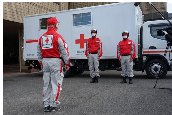
石川県支部に向けての出発式