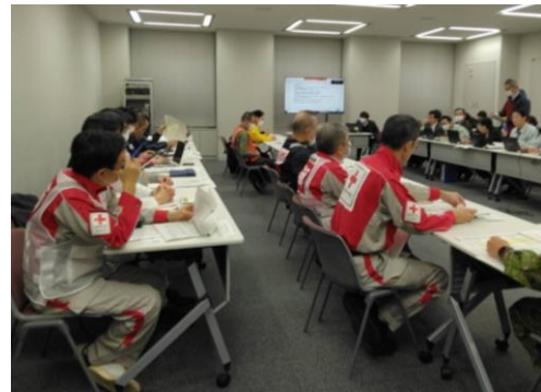
各関係機関との会議の様子