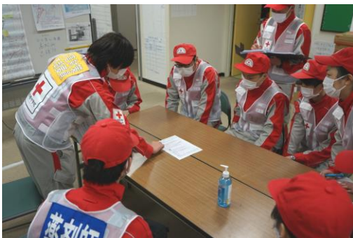
石川県支部で状況説明を受ける 徳島県支部救護班