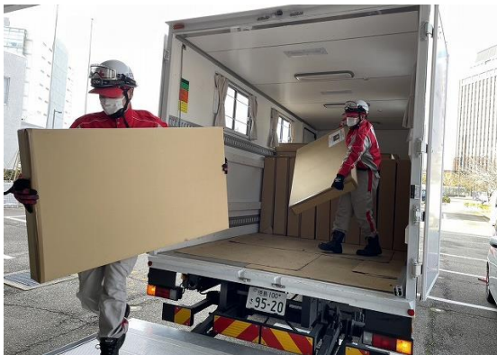
石川県の赤十字施設に段ボールベッドを搬入する徳島県支部の救護員