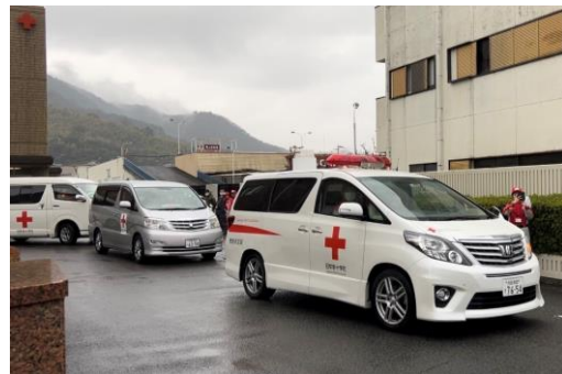
救護車両3台に乗り込み、 出発する医療救護班