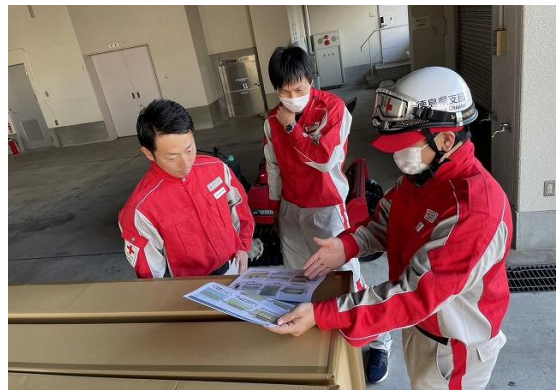
石川県支部職員に段ボールベッドの取り扱いを説明する当支部救護員