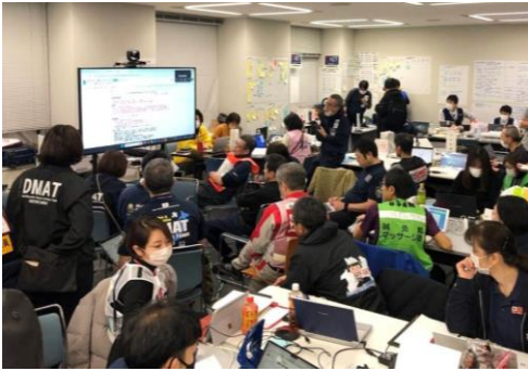
関係機関との会議に参加する徳島県支部コーディネートチーム