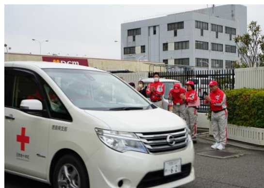
救護車両1台に乗り込み 出発するコーディネーターチーム