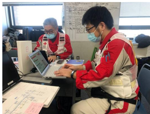
各種本部会議や避難所アセスメント等の資料 作成を行う徳島県支部コーディネーターチーム