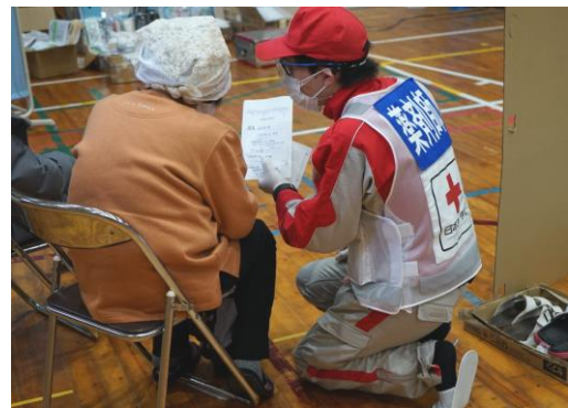
処方薬の説明を行う薬剤師