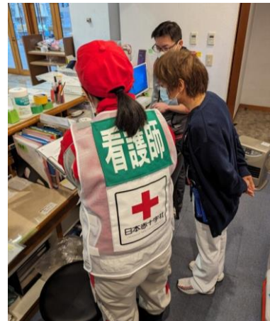
患者の健康状態等について 申し送りを行う看護師