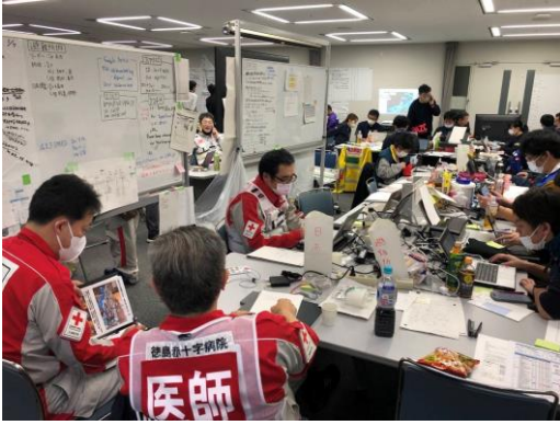
各関係機関と連携し、コーディネート業務等を行う徳島県支部コーディネートチーム