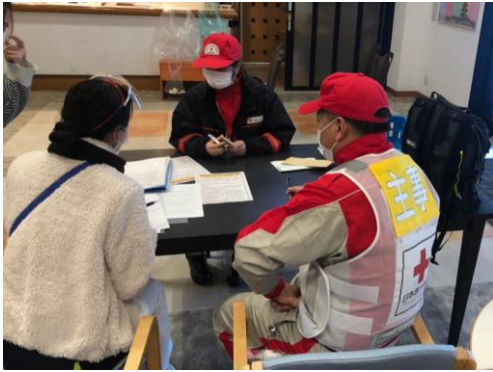
業務の引き継ぎを受ける徳島県支部救護班 (感染症患者待機施設)