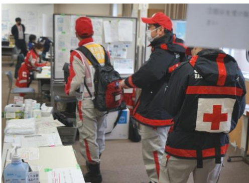
能登医療圏活動拠点本部に到着報告する 救護班 (能登総合病院)