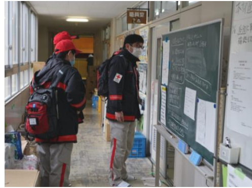
避難所の衛生環境を確認する救護班 (和倉小学校)