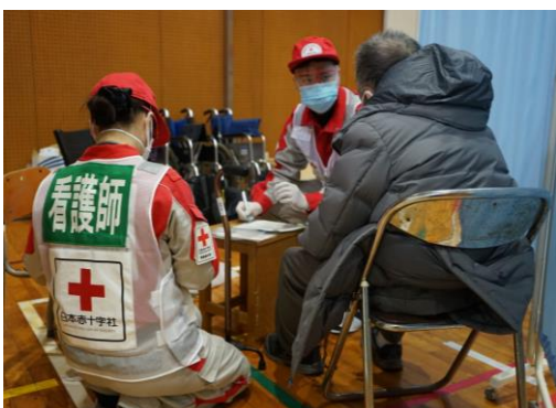
避難所の一角で診療を行う救護員