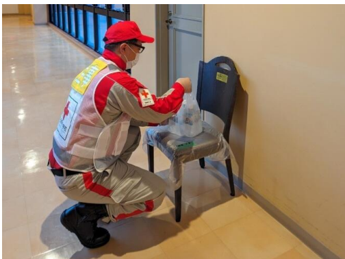
感染症患者に物資を届ける救護員 (志賀町・感染症患者待機施設)