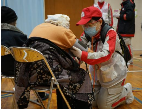
避難者の体調確認を行う看護師