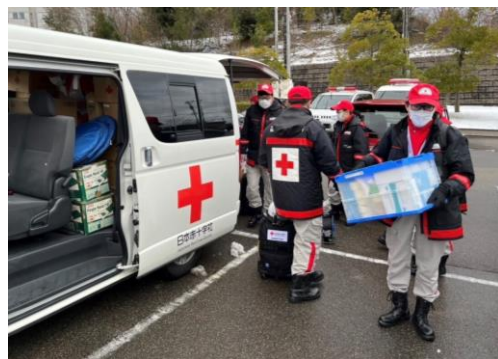
活動場所に向けて、物資を準備する 徳島県支部救護班