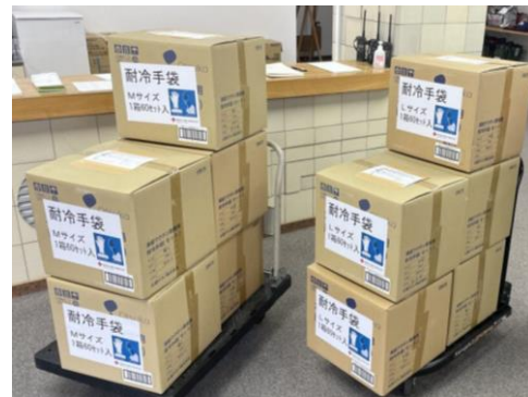
寒冷地での救護活動に活用されます