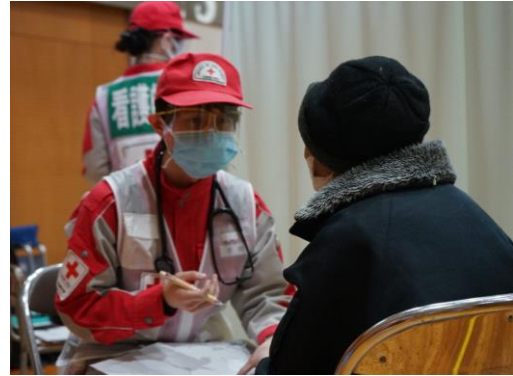
避難者の診察を行う医師