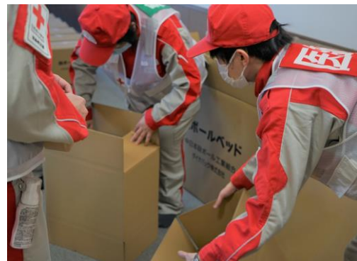
避難所の衛生環境改善のため、 段ボールベッドの組立を行う様子