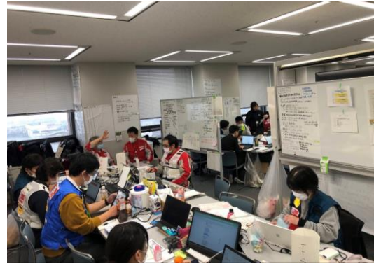
石川県保健医療福祉調整本部で活動する徳島県支部コーディネートチーム