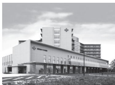
那須赤十字病院（大田原市）