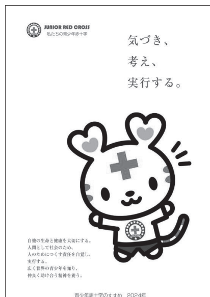
【加盟促進用パンフレット（私たちの青少年赤十字）】