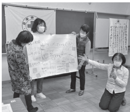
【赤十字ボランティア・リーダーシップ研修会の様子】

※「赤十字ボランティア基礎研修会」及び「赤十字ボランティア・リーダーシップ研修会」については、地区区分においても適宜実施します。