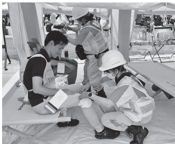
【宇都宮市総合防災訓練に参加する救護班員】

日本赤十字社本社・第2ブロックが主催する救護関係の会議等に参加するとともに、支部及び管内赤十字施設間の連携の強化、救護計画等の修正や赤十字救護員育成に関する研修・訓練内容について検討する会議を開催します。