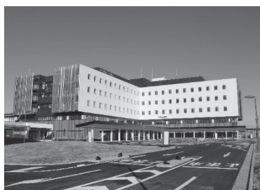
芳賀赤十字病院（真岡市）

当支部管内には、芳賀赤十字病院、那須赤十字病院及び足利赤十字病院の3病院が設置されており、当支部では、救護活動をはじめとした各事業の展開にあたり、管内赤十字病院と連携を図るほか、関係自治体等との調整に努めます。