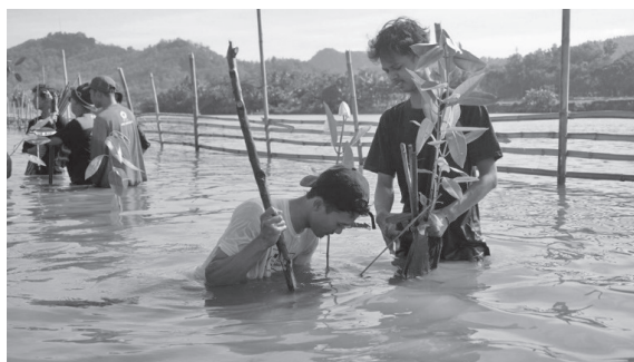
【マングローブを植林するインドネシア赤十字社防災ボランティア】