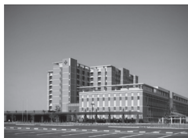
足利赤十字病院（足利市）