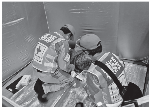
【日本赤十字社第2ブロック支部総合訓練に参加する救護班員】