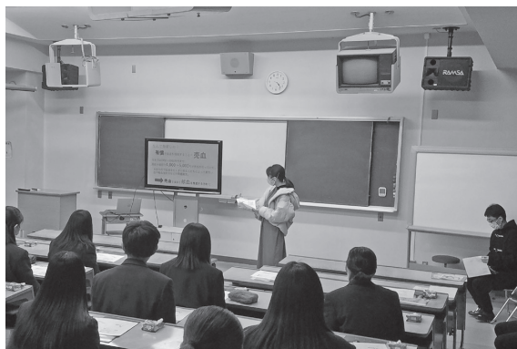
【栃木県内の高等学校で開催された「献血セミナー」の様子】