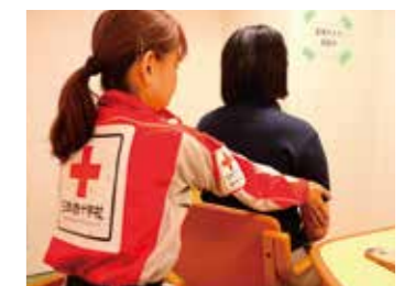
リラクゼーションを行うこころのケア要員

これらの活動は、皆様からのご支援により続けることができます。引き続き、赤十字活動資金にご協力をお願いいたします。