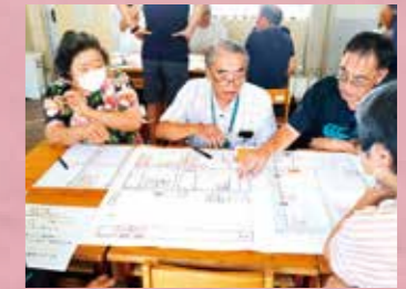
ひなんじょたいけんでのグループワーク

静岡県支部では、地域の防災力向上を支援するため、防災や減災に関する知識や技術を学べる「赤十字防災セミナー」を自治会等を中心に県内各地で開催します。