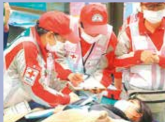
仮想傷病者の状態を確認する救護班