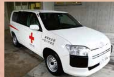
災害救護用自動車

また、市町への支援として発災時に避難所の状況確認やニーズを調整する職員派遣のための災害救護用自動車や、被災者へ迅速に救援物資をお届けするための救護用倉庫を更新します。