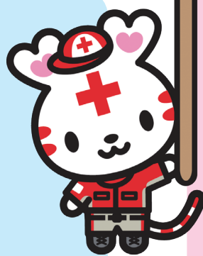
日本赤十字社キャラクター ハートちゃん