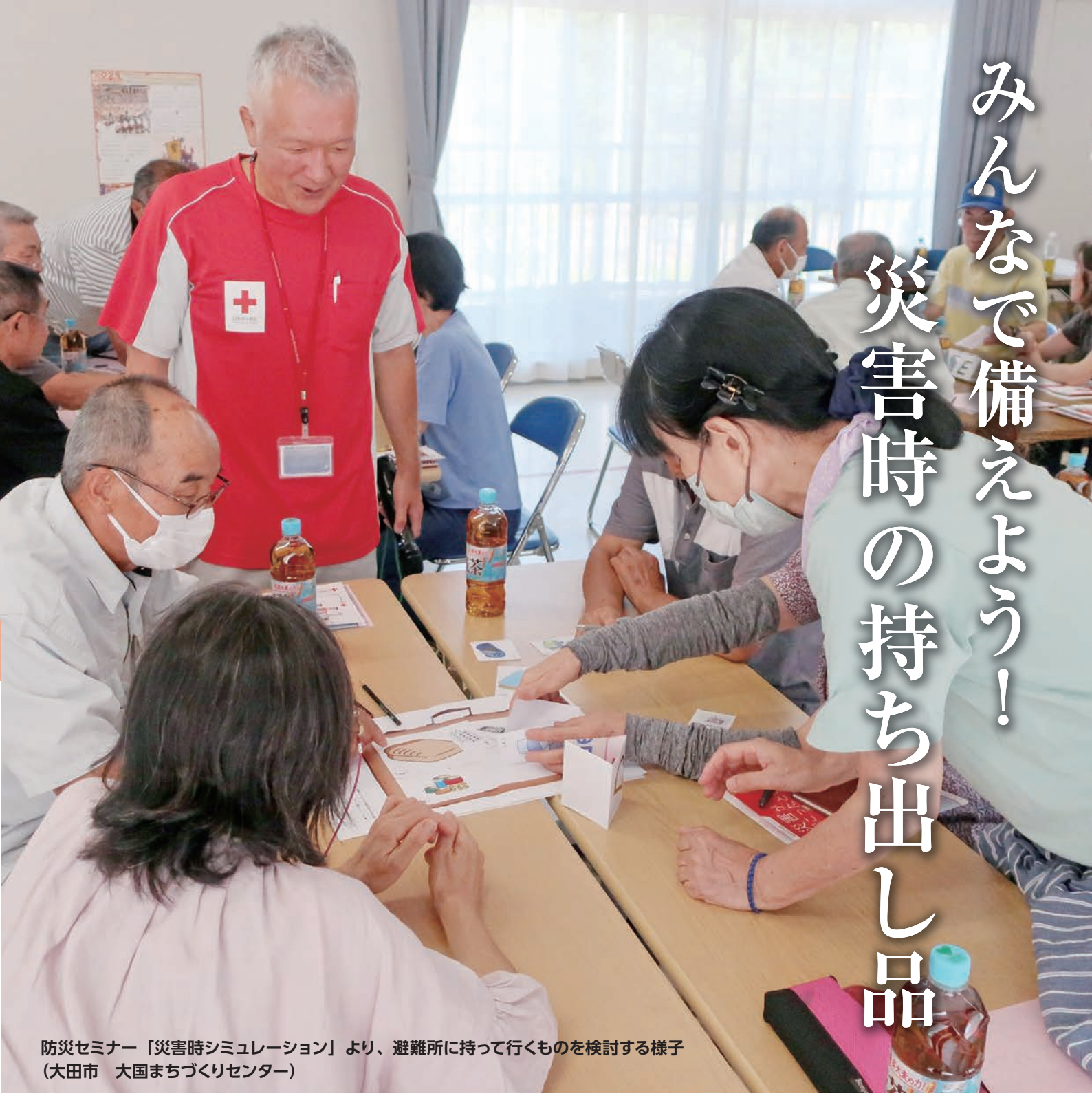
防災セミナー「災害時シミュレーション」より、避難所に持って行くものを検討する様子 (大田市 大国まちづくりセンター)

島根の皆さまのご協力（日赤会費・寄付金）のおかげで、私たちは、大切な“いのち”を救う活動をつづけていくことができます。日ごろのご支援に心より感謝申し上げます。