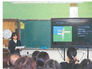
平和について学ぶ