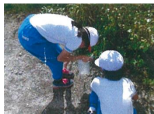
山林での野外活動