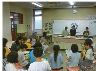
たてわり班での校内活動