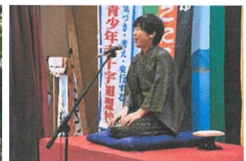
チャリティー落語寄席