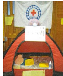
防災について学ぶ