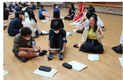
国際理解・親善活動の様子。外国の方とクイズなど通じて交流しました。