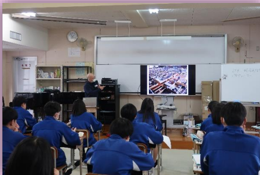
災害・防災についての講義