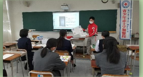
高校 JRC 部でのオリエンテーション