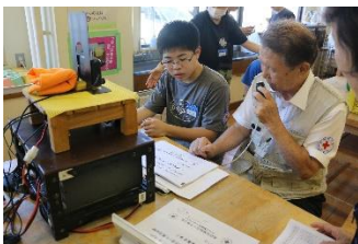
技術研修（無線を使った通信体験、手話、災害時に役立つ技術）の様子。 この他にも、みんなで楽しめるレクリエーションの方法、がありました。

参加者は小学校 13 名、中学校 22 名、高校 20 名の合計 55 名。他校の生徒とともに 2 泊 3 日を共に過ごす中で、個々のリーダーシップを育むとともに友情も深まりました。