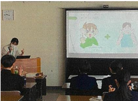
松江南高校：手話の学習