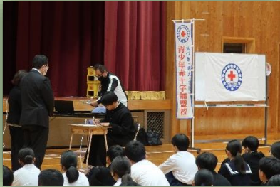
加盟登録式の様子

日本赤十字社島根県支部では、学校での赤十字活動に様々な形で協力をしています。 詳細につきましては島根県支部まで、お気軽にお問い合わせください。