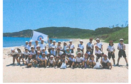
鳥井小学校：海岸清掃