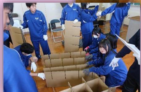
段ボールベッドの組み立て