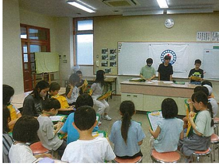
津田小学校：たてわり班活動