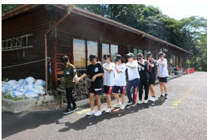
フィールドワークではホームルームの仲間と協力して様々な関所を突破します。