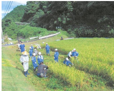
井尻小学校：お米作り体験