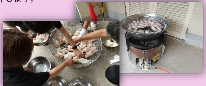
ハイゼックス袋を用いた炊き出し体験