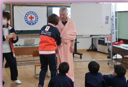
災害時に役立つ技術(毛布ガウン)