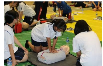
赤十字救急法を受講している様子。