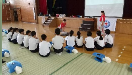
赤十字救急法の講習