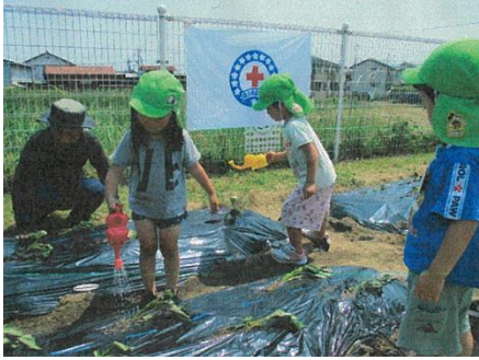
意東幼保園：サツマイモ栽培