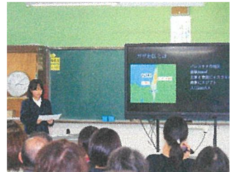
西益田小学校：平和について学ぶ