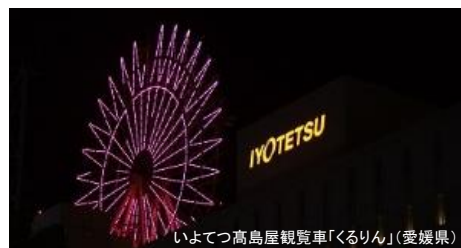
いよてつ高島屋観覧車「くるりん」(愛媛県)