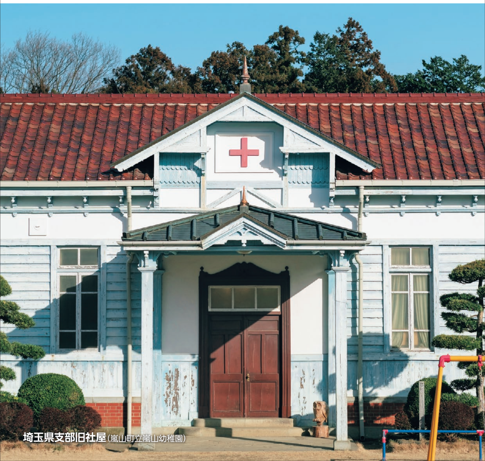
埼玉県支部旧社屋 (嵐山町立嵐山幼稚園)