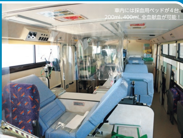
車内には採血用ベッドが 4 台。 200mL、400mL、全血献血が可能！

令和 2 年度は全国で 12 台の献血バスを寄贈いただき、そのうち 1 台が埼玉県内に配備されました。近くに献血ルームがないという方のために、県内の企業や大学の会場、大型ショッピングモールや駅前へ伺います！